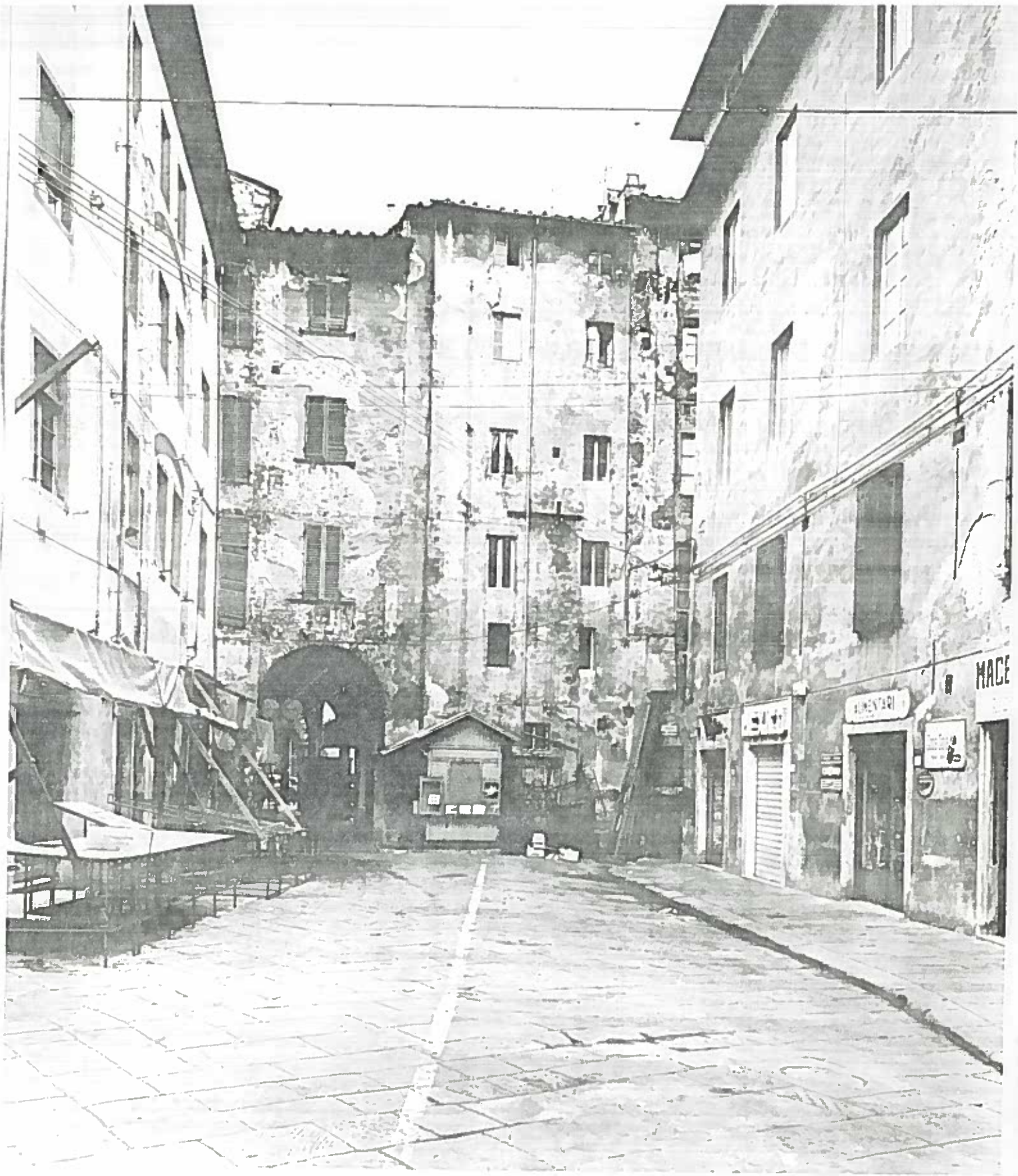
VIA D. CAVALCO VISTA DA P.zza S. OMOBONO