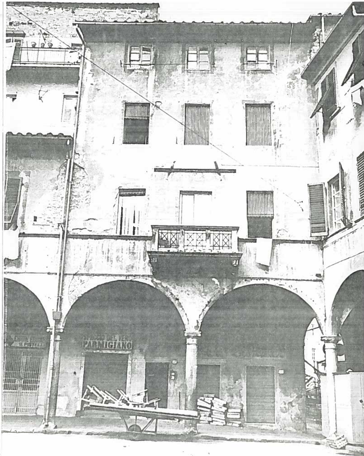
Pra delle Vettovaglie n 26-27-28 ISOLATO n 26 203/13 NEGATIVO 18494