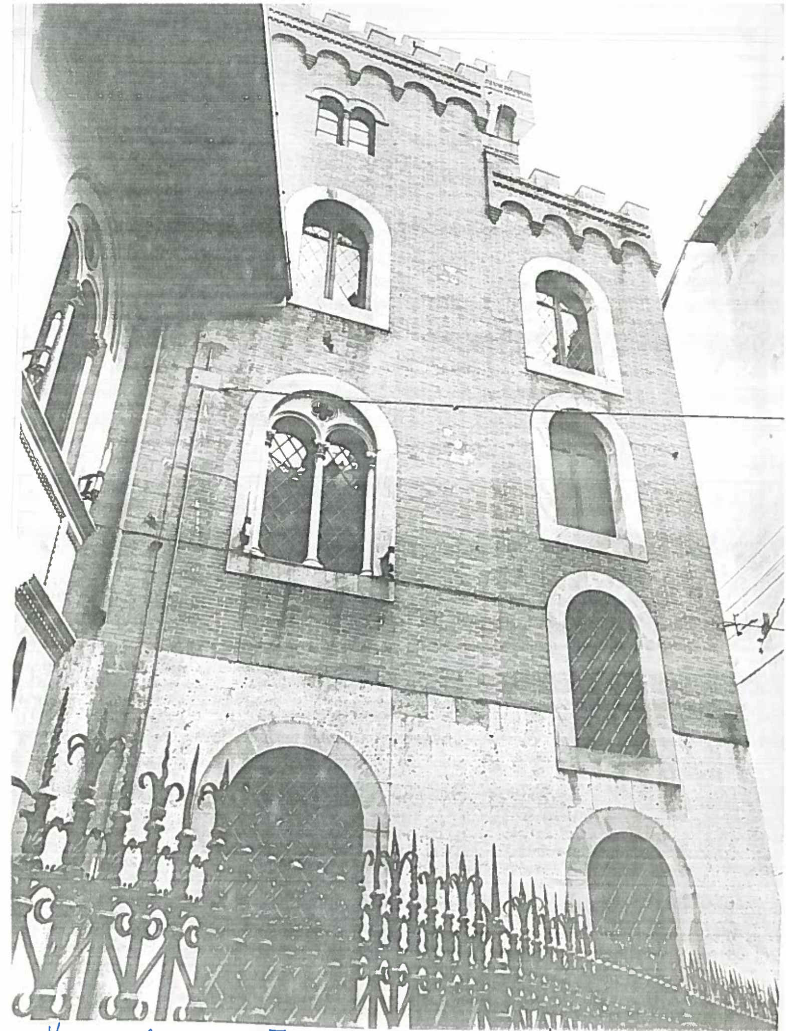
VIA DEL MONTE PART. TORRE