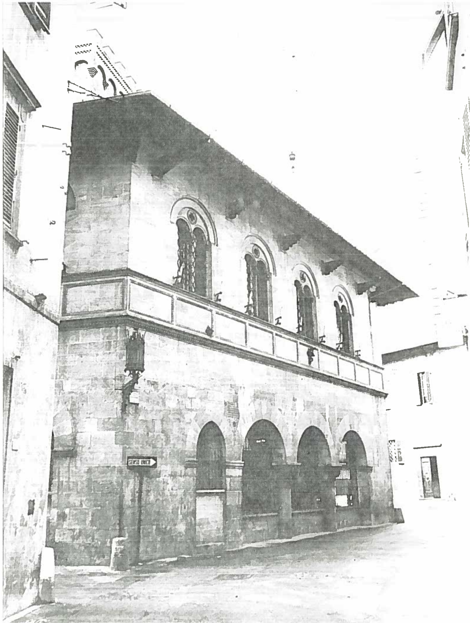
VIA DINI CASSA RISPARMIO