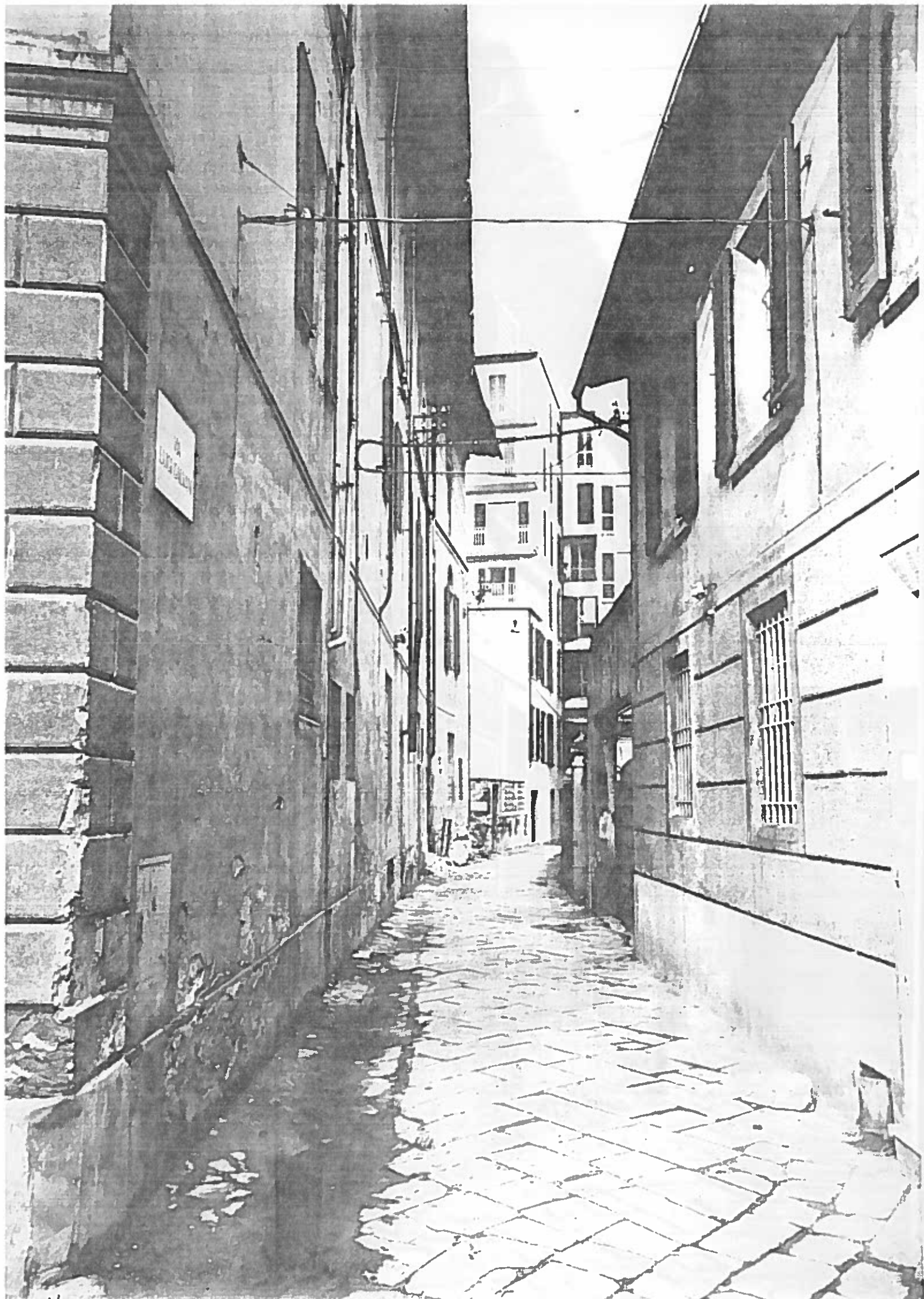
VIA GIULIANI, VEDUTA DA D. DONA TRODICE... ICNANTH/172/100 NEGATIVO 19077