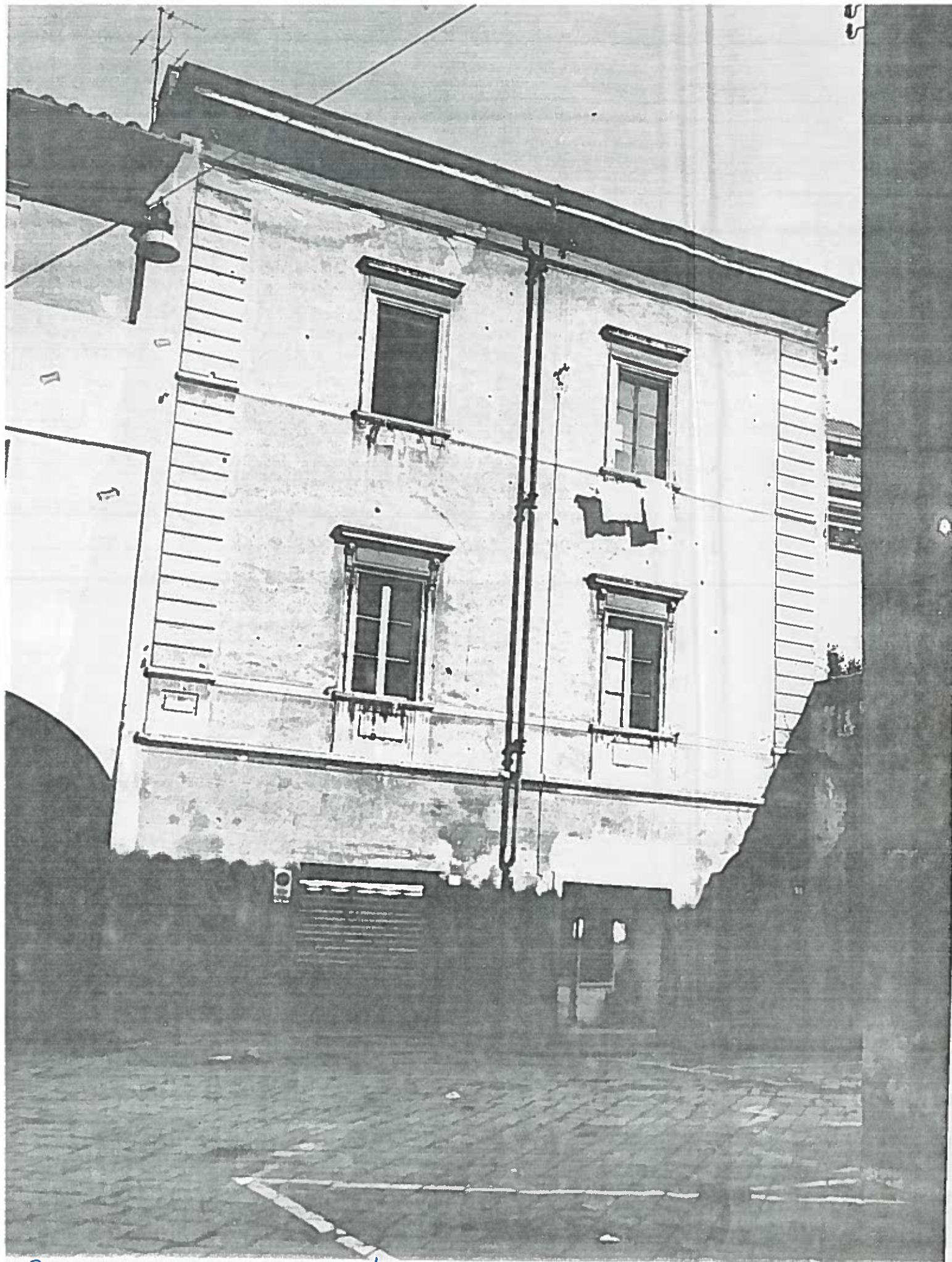
P. via S. Giorgio 1/2/3 Isolato 65 NEGATIVO 18869