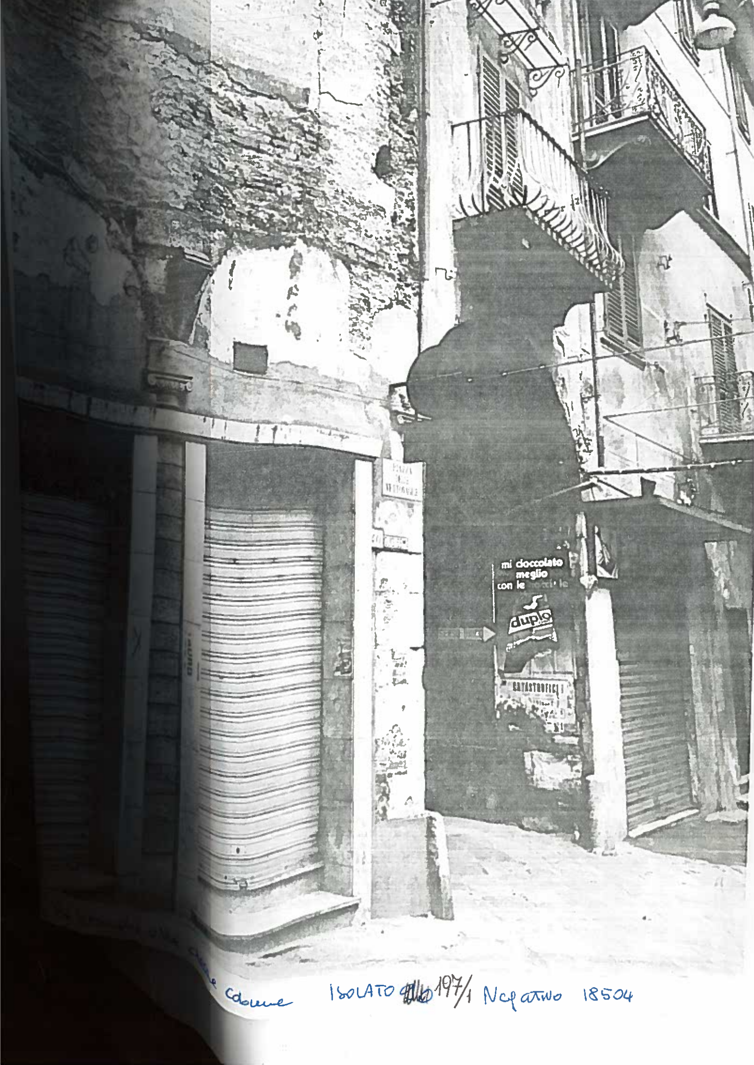
Colonne Isolato 116/197/1 Negativo 18504