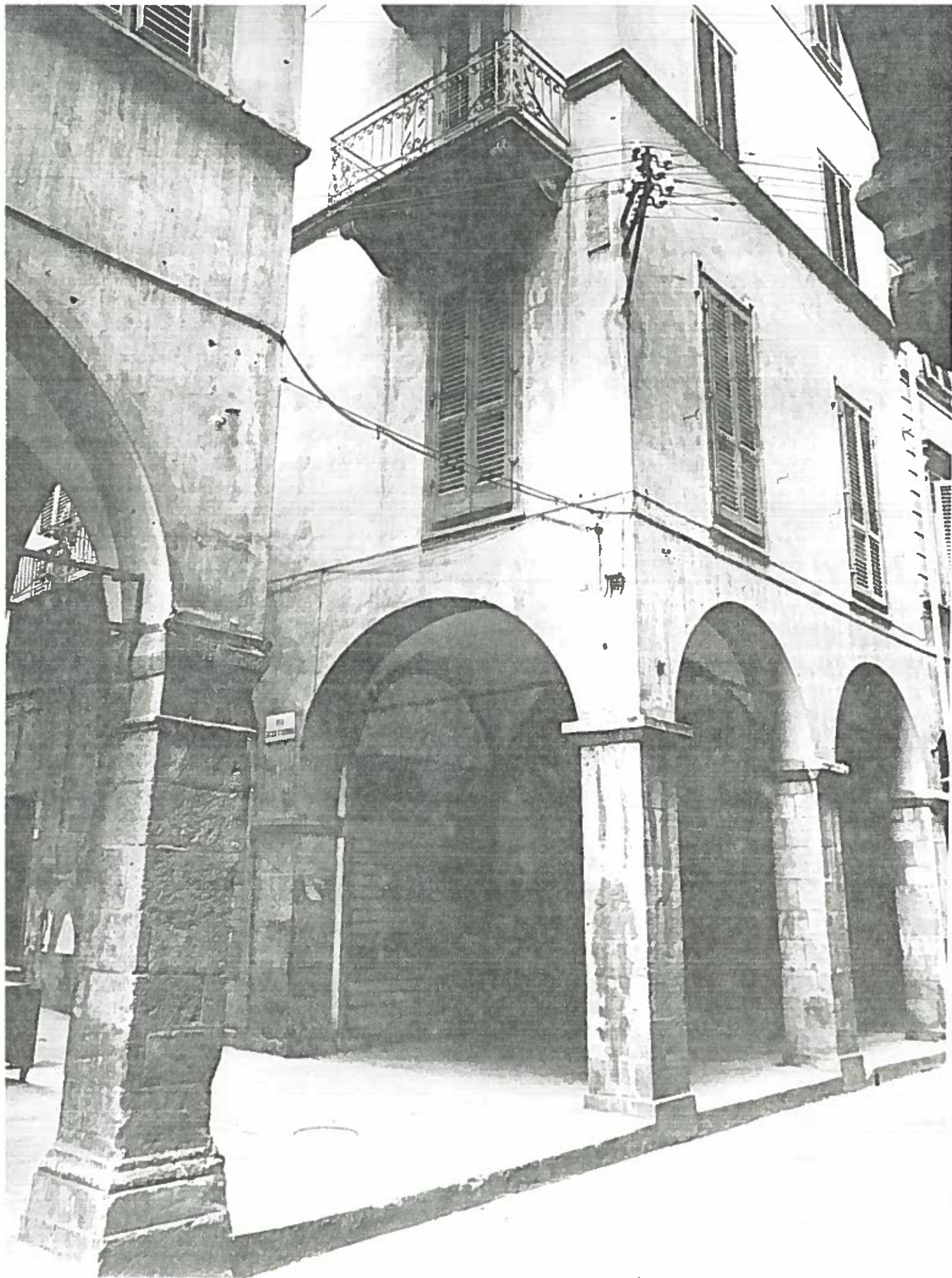
Borgo Strada e Vie delle Glorie ISOLA D'ISCHIA 197/1 Negativo 18615.