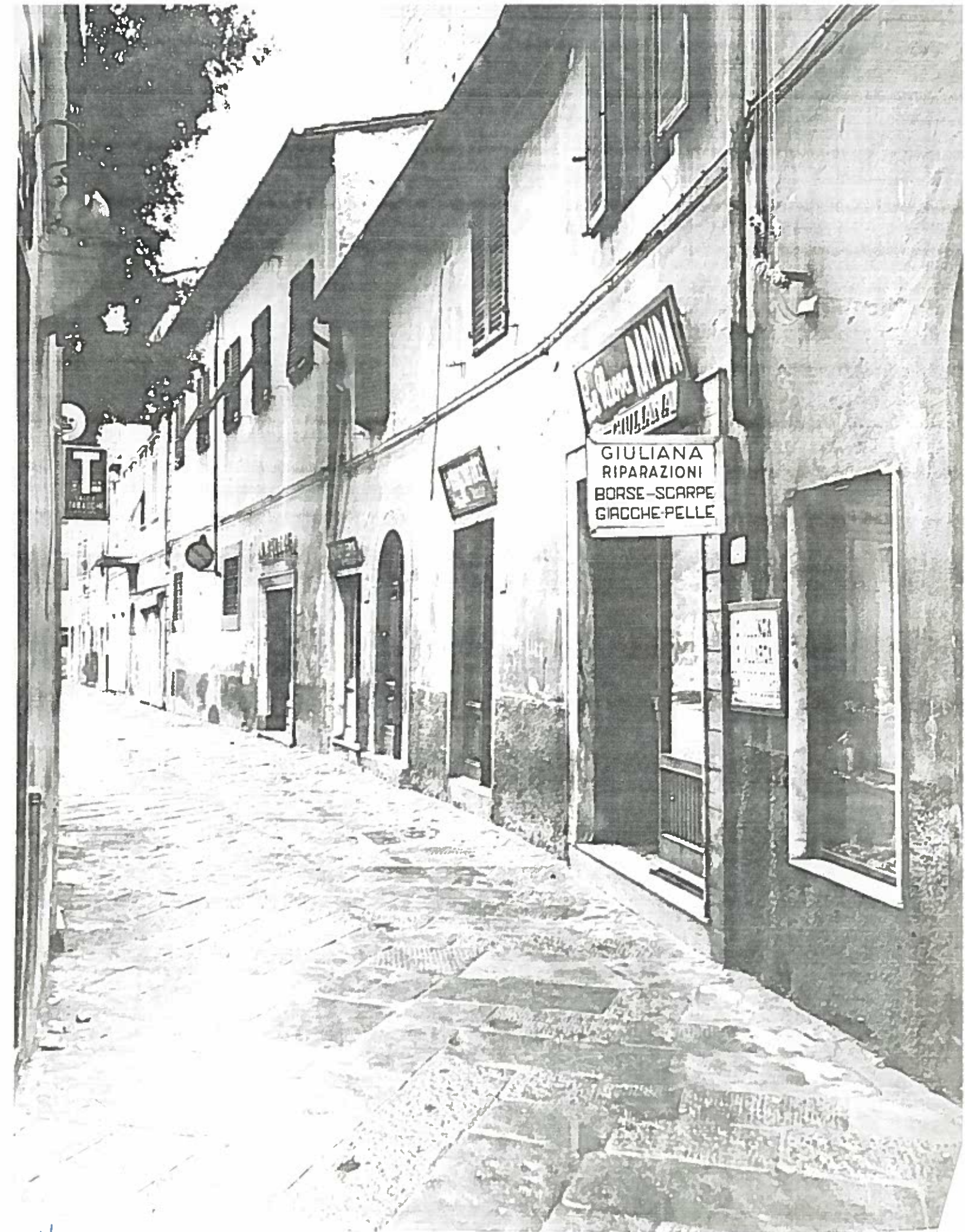
VIA L'ARANCIO DAL 4 AL 8 ISOLATO 68 196/6 NEGATIVO 19422