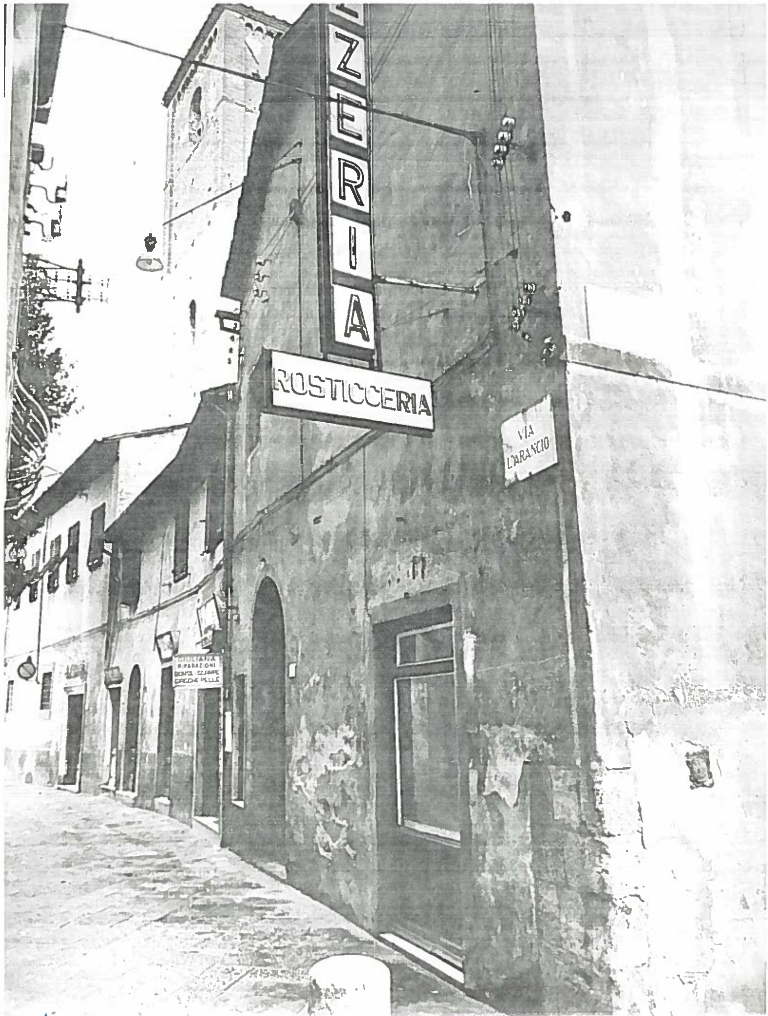
VIA L'ARANCIO DAL 2 AL 8