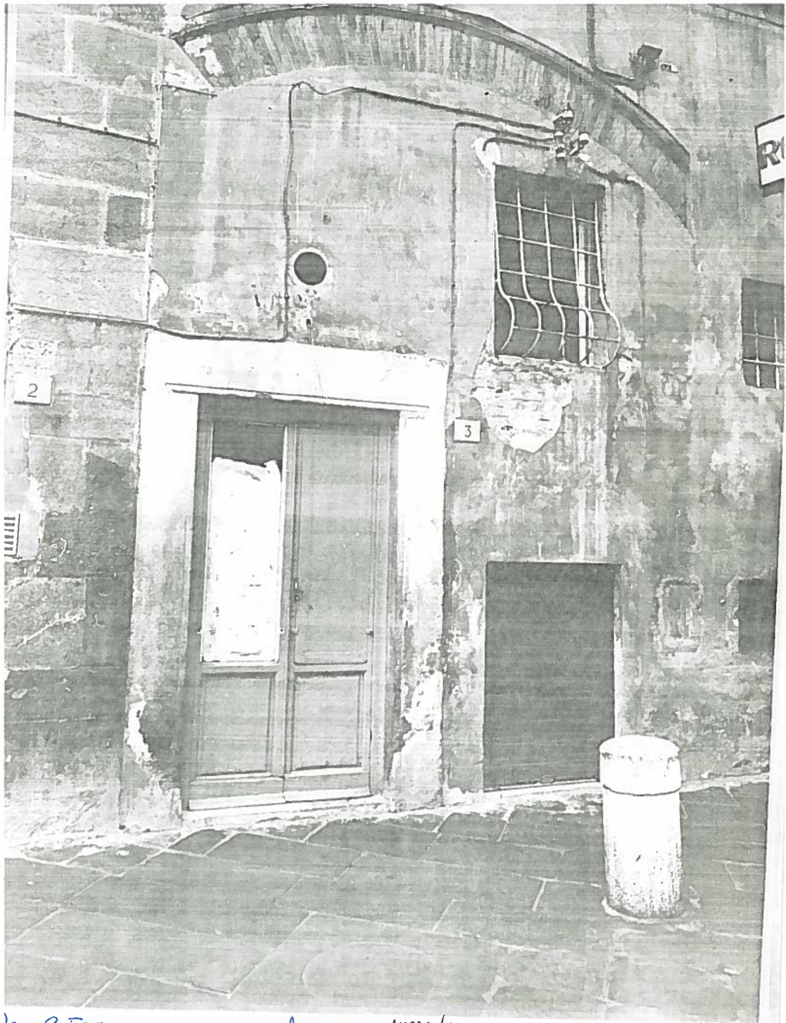
VIA S. FREDIANO 3