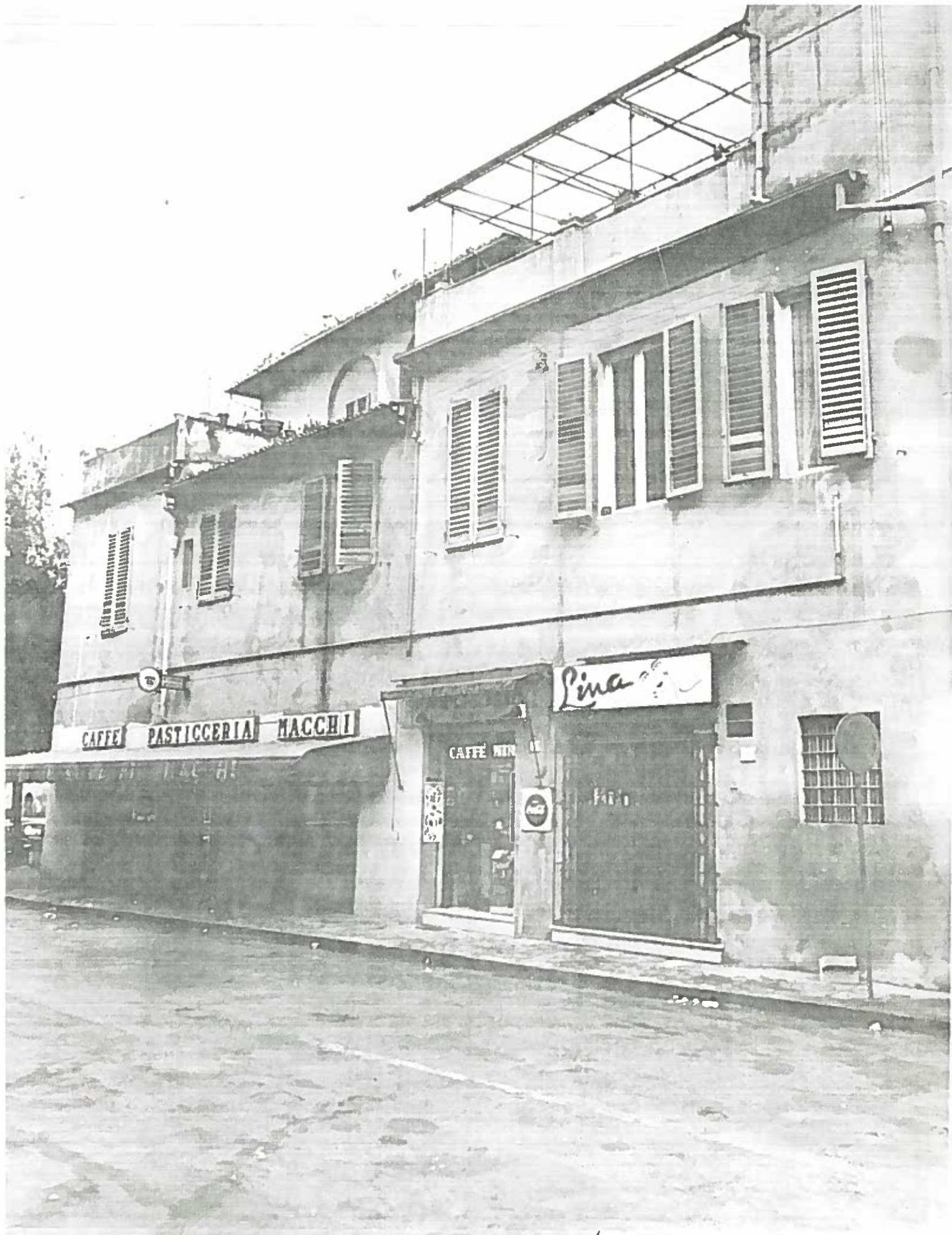
VIA TANUCCI 214/6