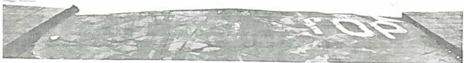
VIA CURTATONE E MONTANARA 17-19-21 ISOLATO 177/1 NEGATIVO 14096