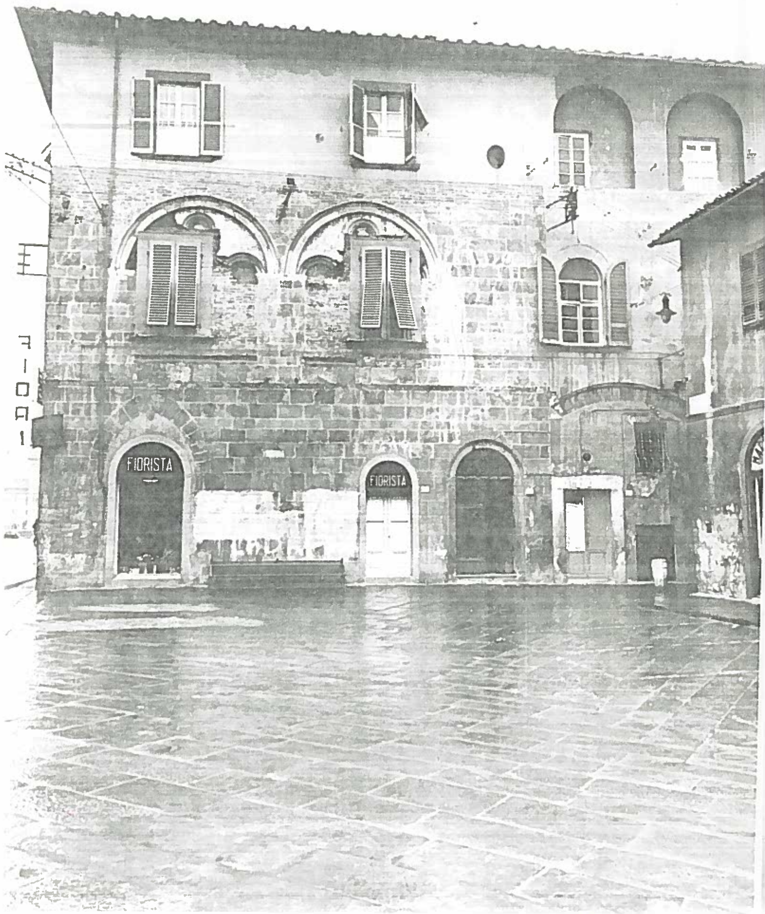
P.zza S. FREDIANO 1/2/3 ISOLATO 177/1 NEGATIVO 19132