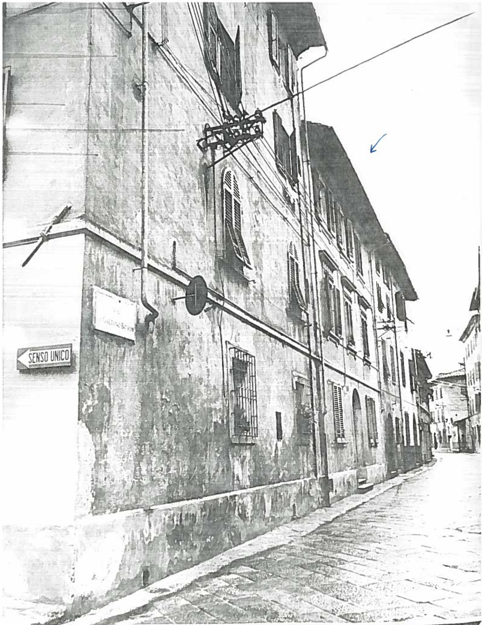
VIA BOSCHI 1/3/5/7