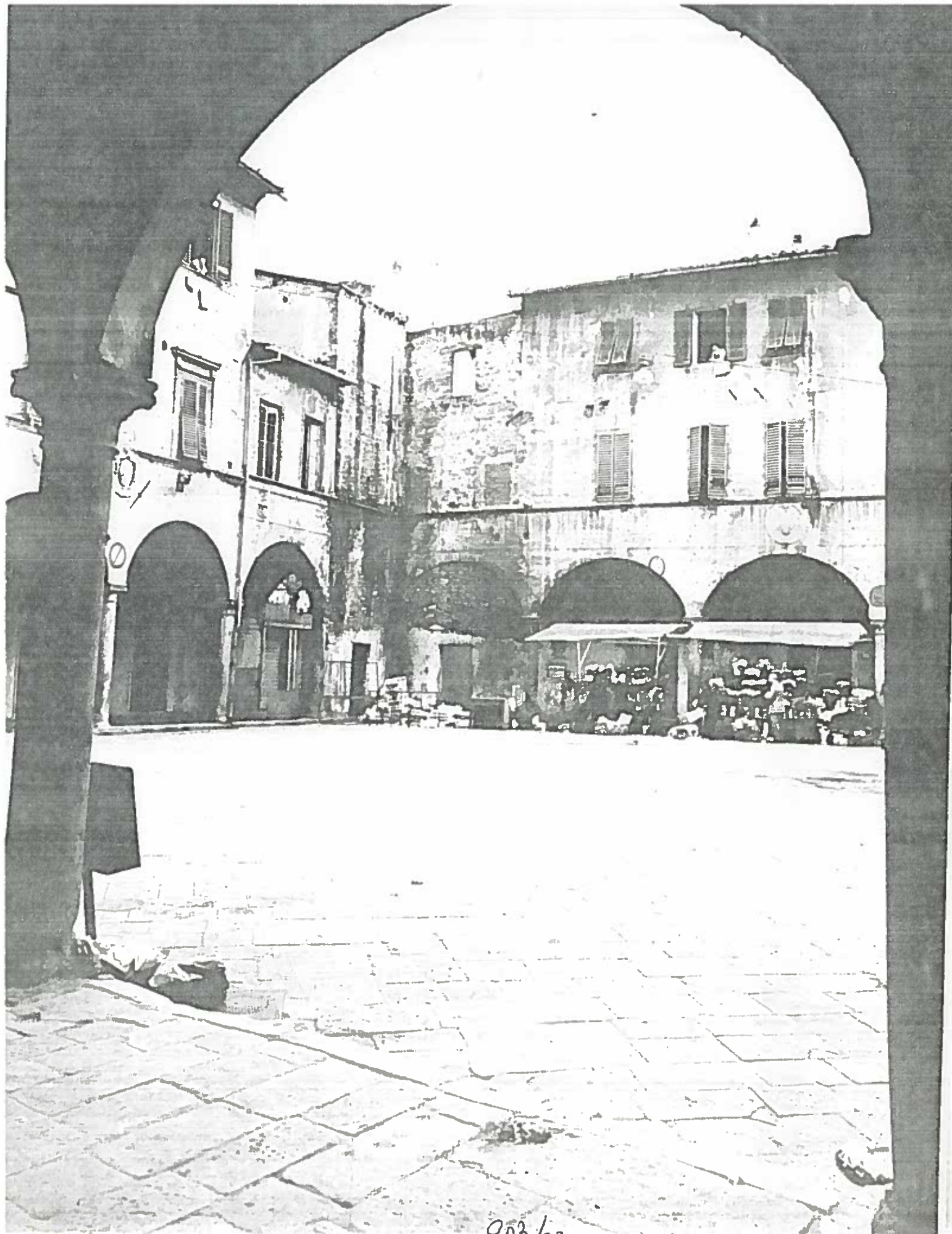
Pia VETTOVAGLIE ISOLATO n. 59 203/22 Negativo 18500 14-21