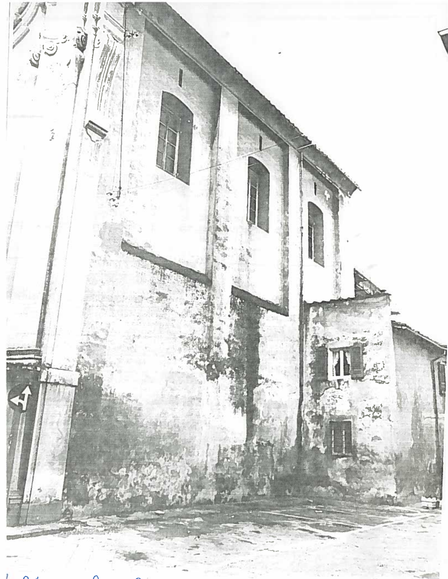
VIA S. APOLLONIA - CHIESA S. APOLLONIA FIANCO DESTRO ISOARO 466/26 NEGATIVO 19519