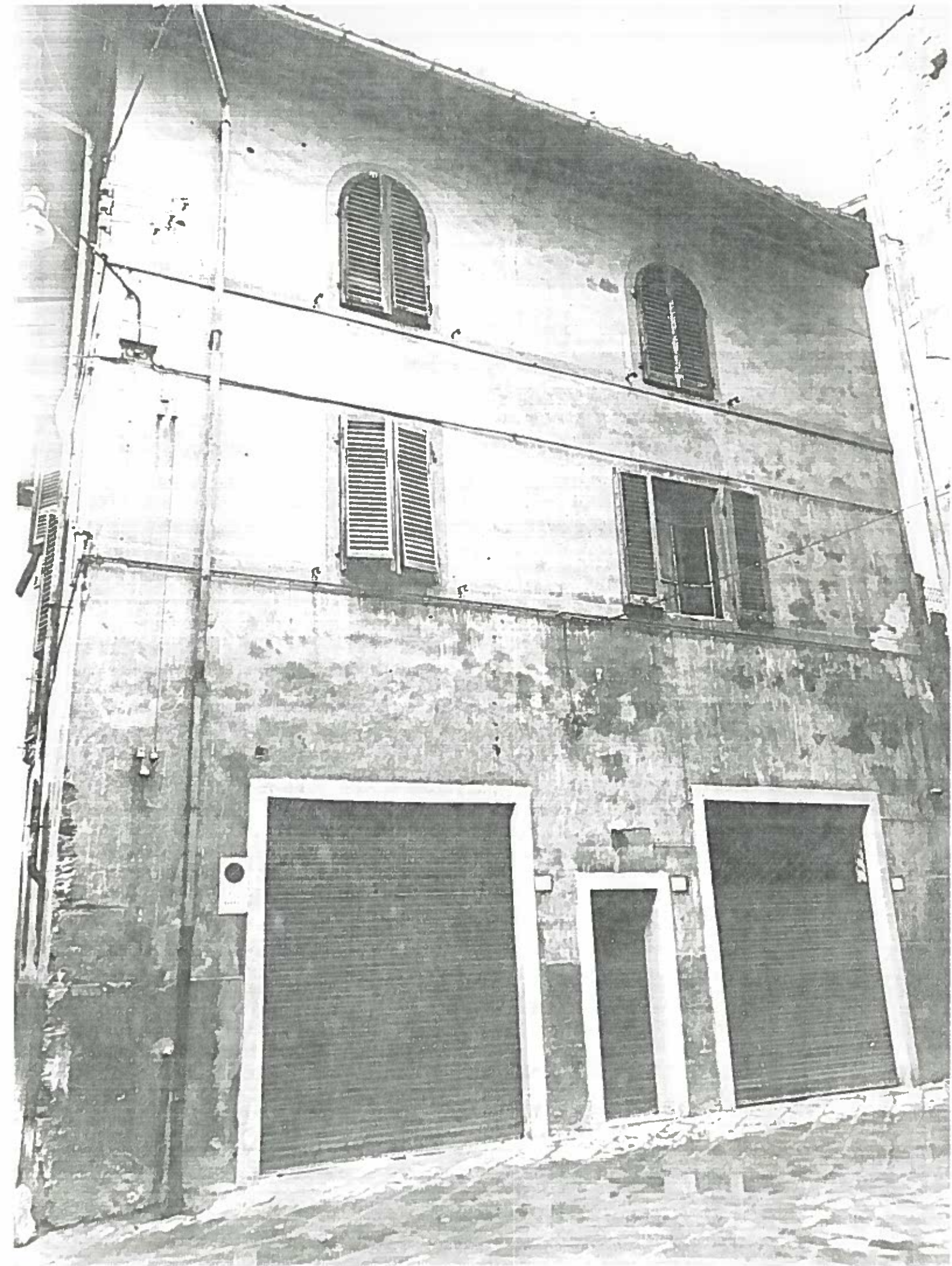
VICOLO DEL TIDI 5-7-9