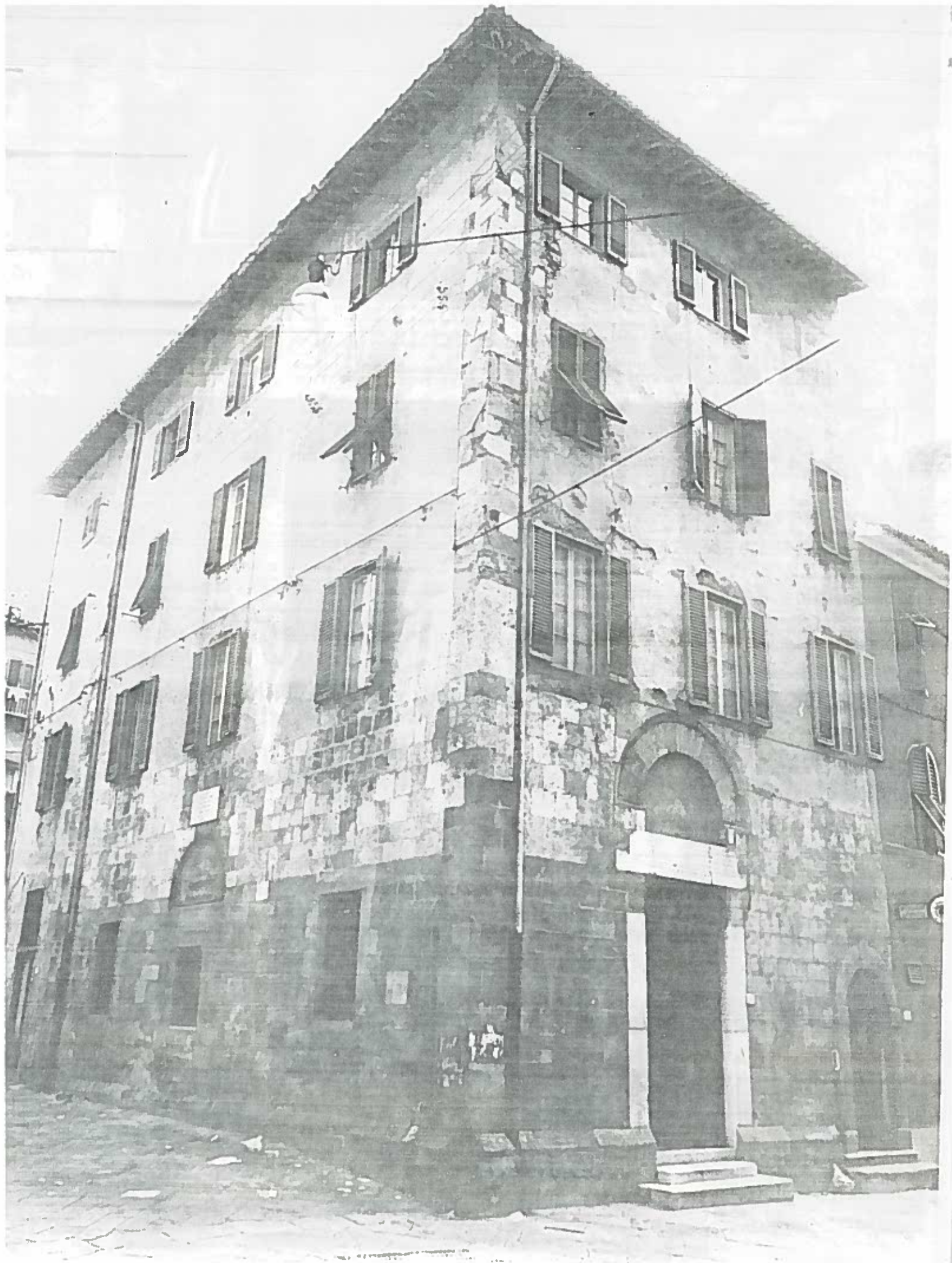
VIA DELLA SAPIENZA 3 ANG. VIA SERAFINI SOCATO 188/8 NEGATIVO 1882