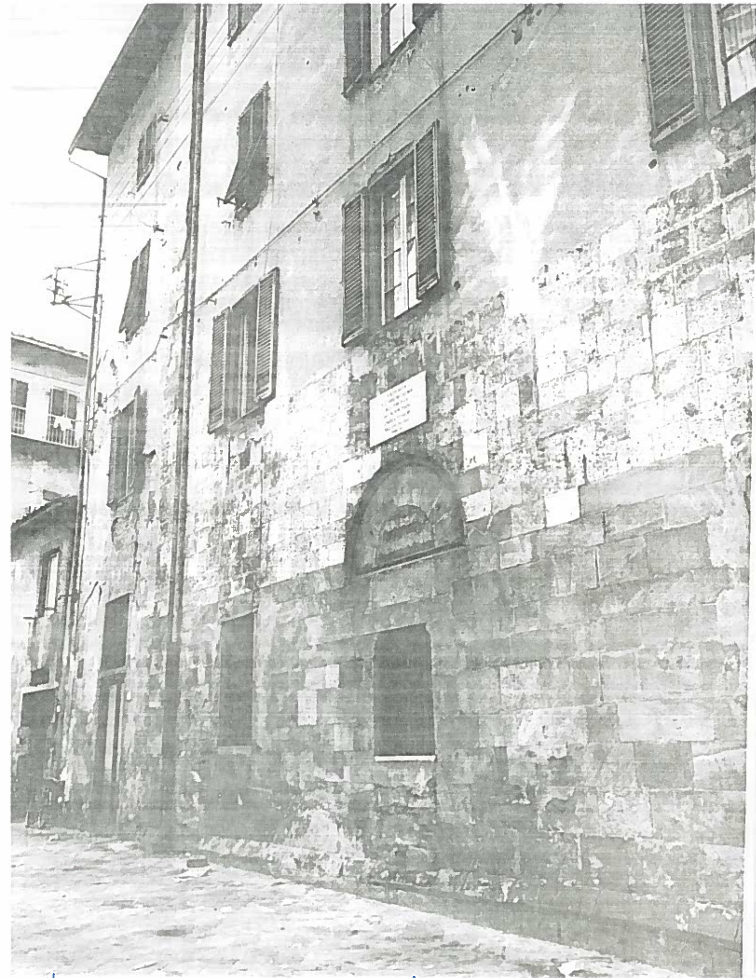
VIA DELLA SAPIENZA 3 ANG. VIA SERAFINI SOCATO 188/8 NEGATIVO 18813