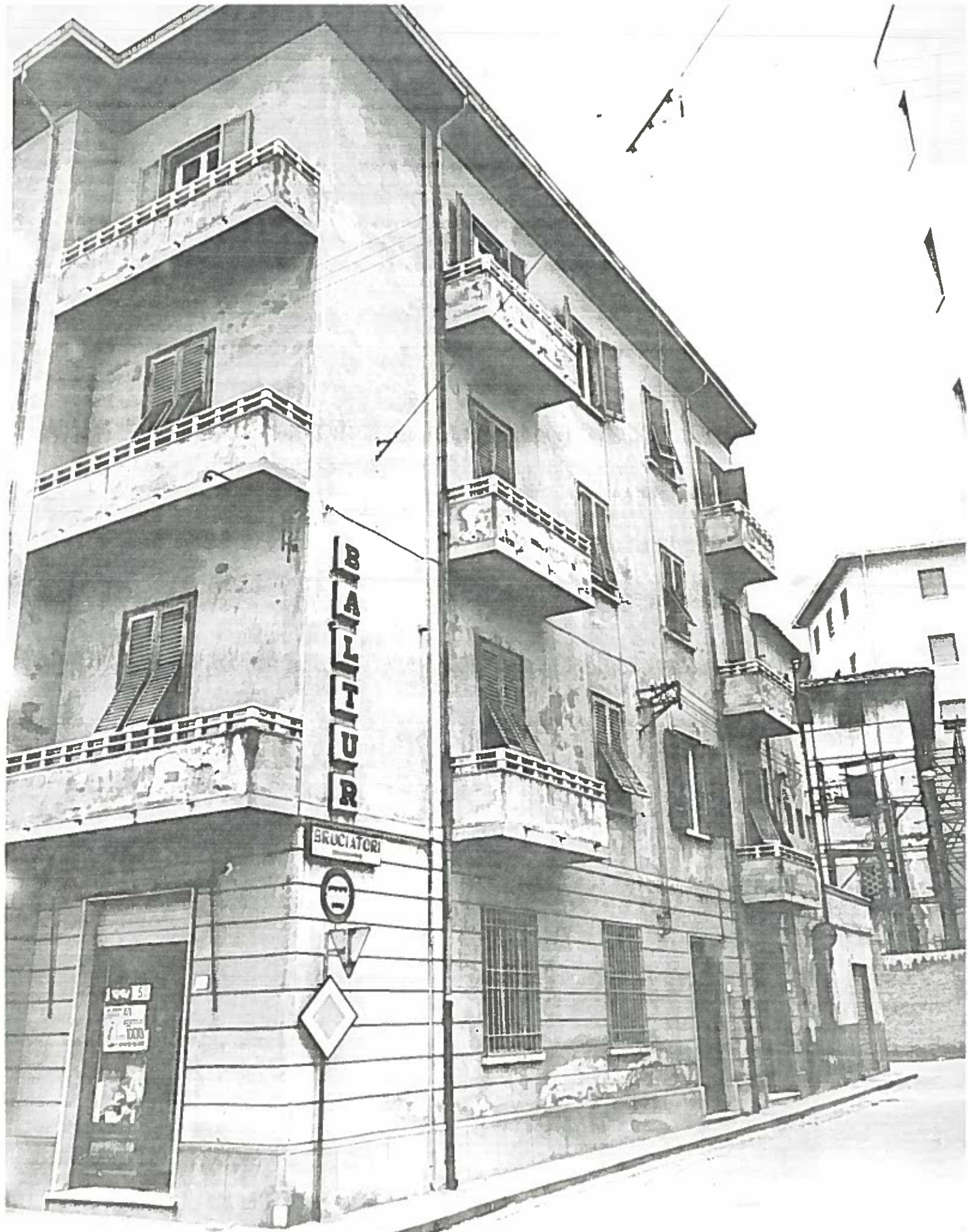
P.zza Locchi 5/6 ANG VIA ROMA 2 ROMA 51 NEGATIVO 1973