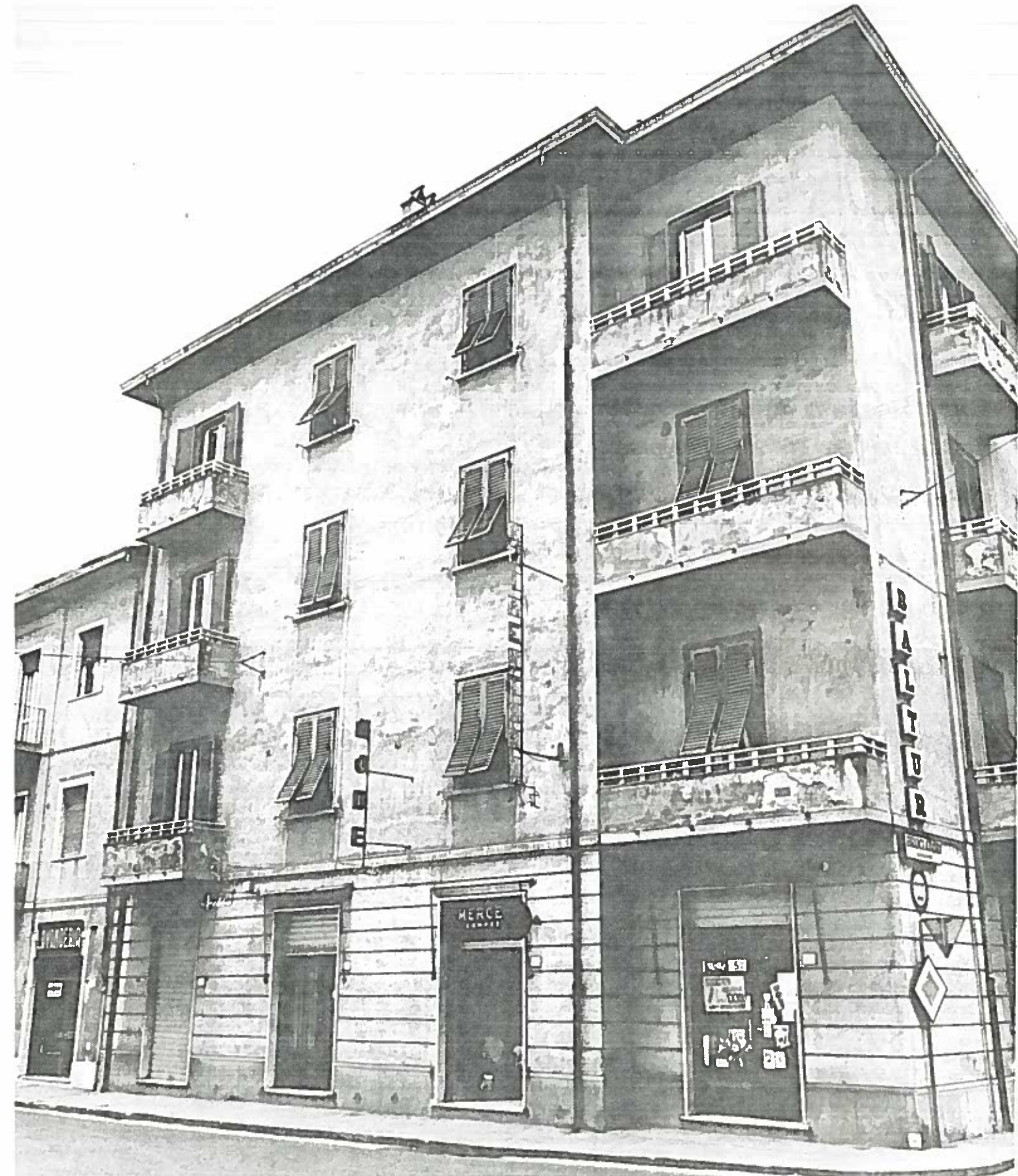
VIA ROMA DAL 2 AL 8 ISOIATO 51 NEGATIVO 1975