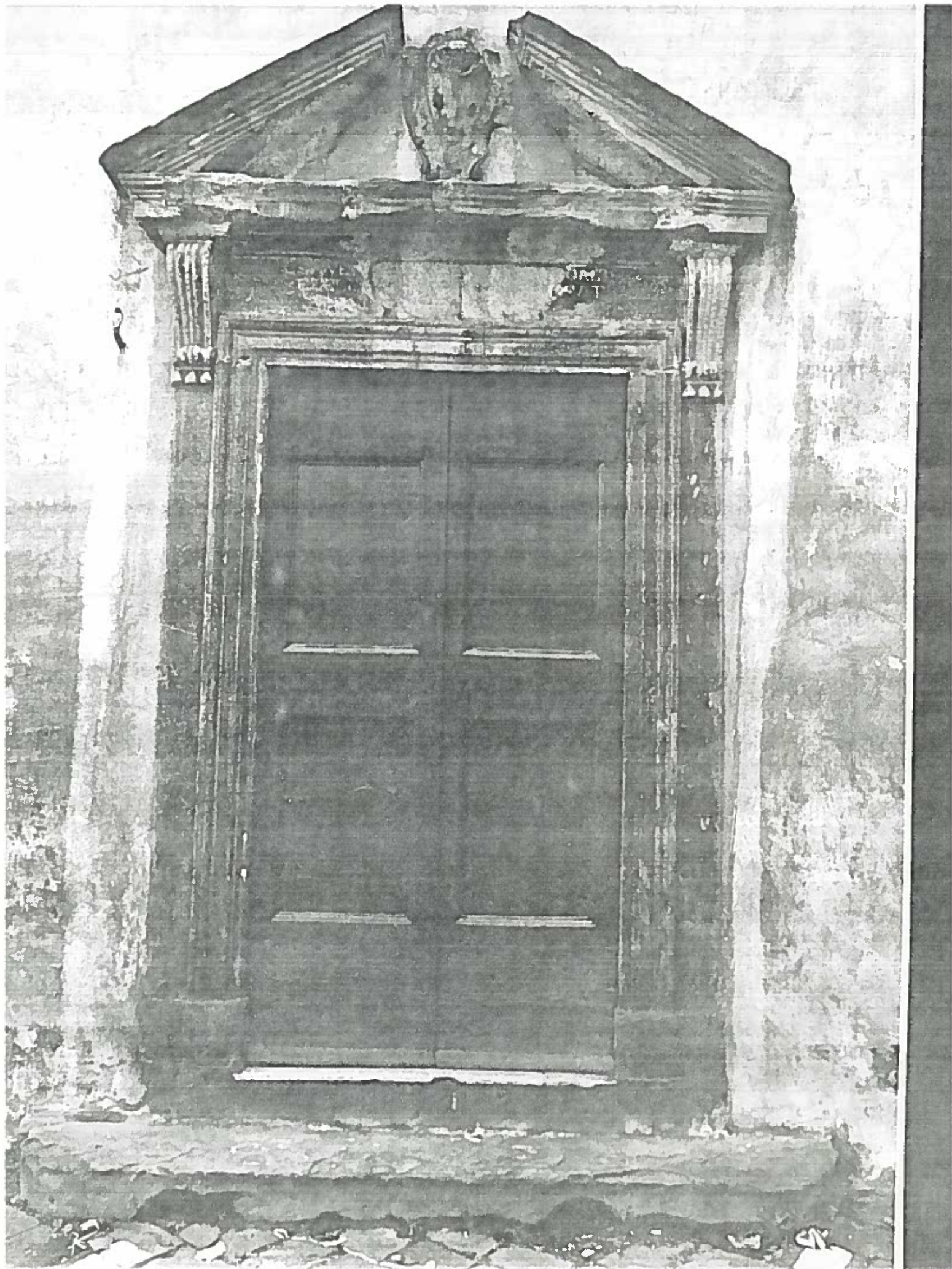
Piazza S. Giorgio Portale Chiesa Isolato 65 Negativo 18871