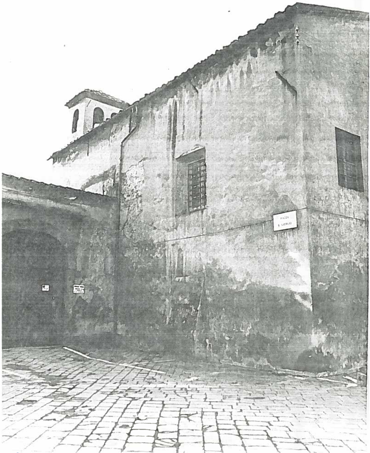
Pienza S. Giorgio