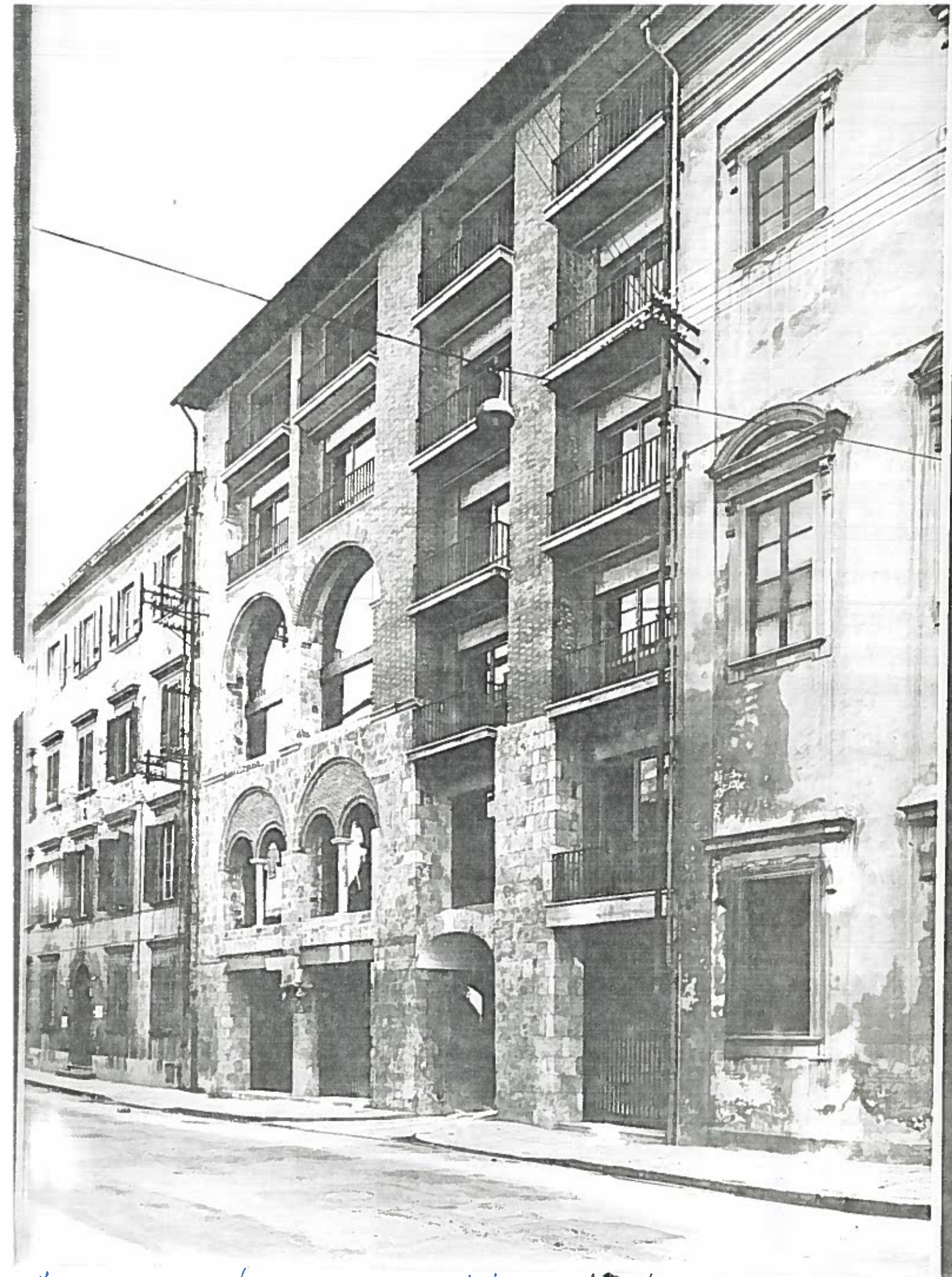
VIA S. MARIA 30 (PALAZZO CINI DA SIORNO) ISOLATO 183/22 NEGATIVO 14009