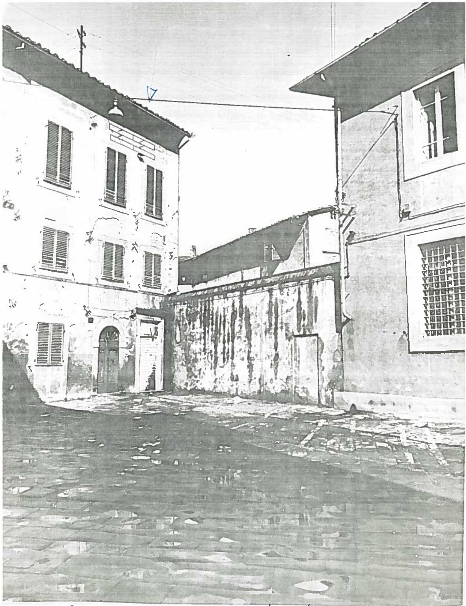
Piazza del Particello