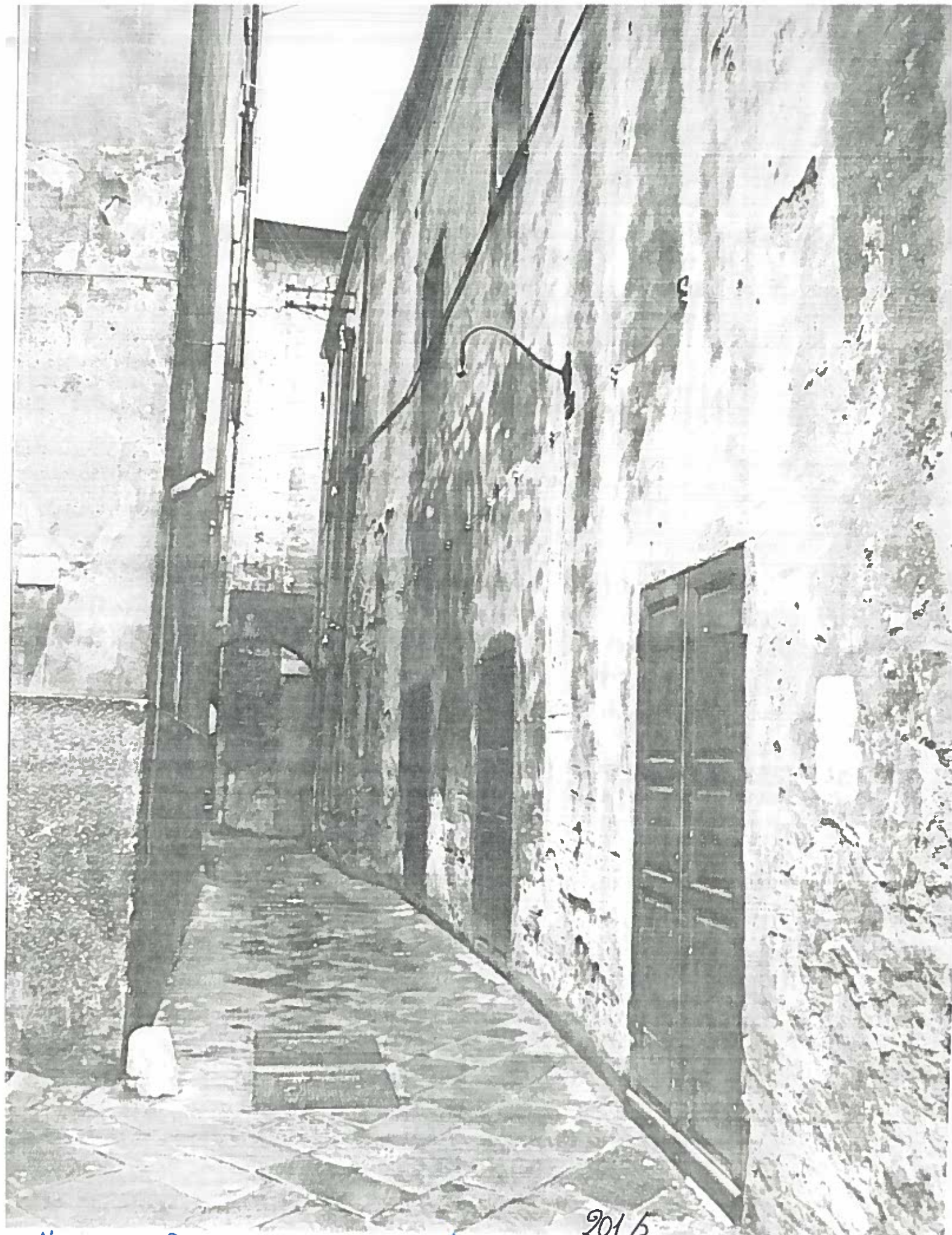
VICOLO DEL PORTON ROSSO