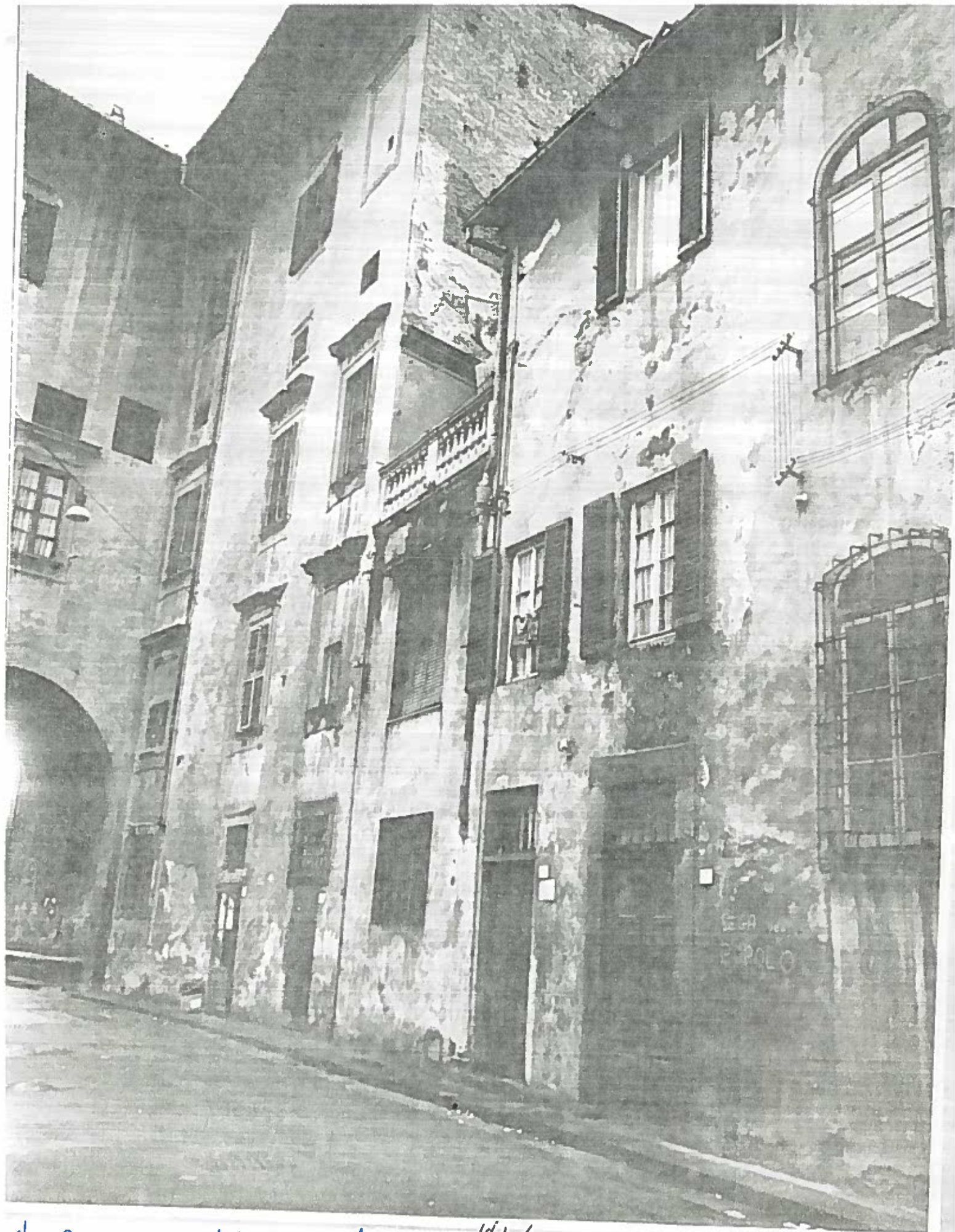
VIA DAMAZIA 1/3/5/7 ISOLATO 1/64/3 NEGATIVO 18131