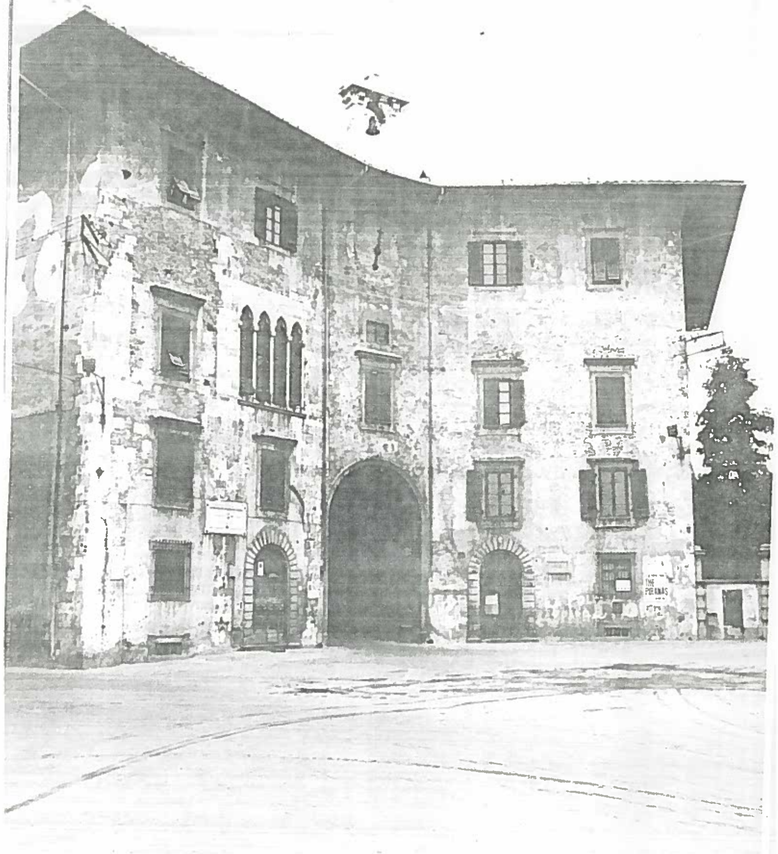
PIAZZA DEI CAVALIERI 1/5 (PALAZZO DELL'OROLOGIO) PISTOIA 164/35 NEGATIVO 1911C