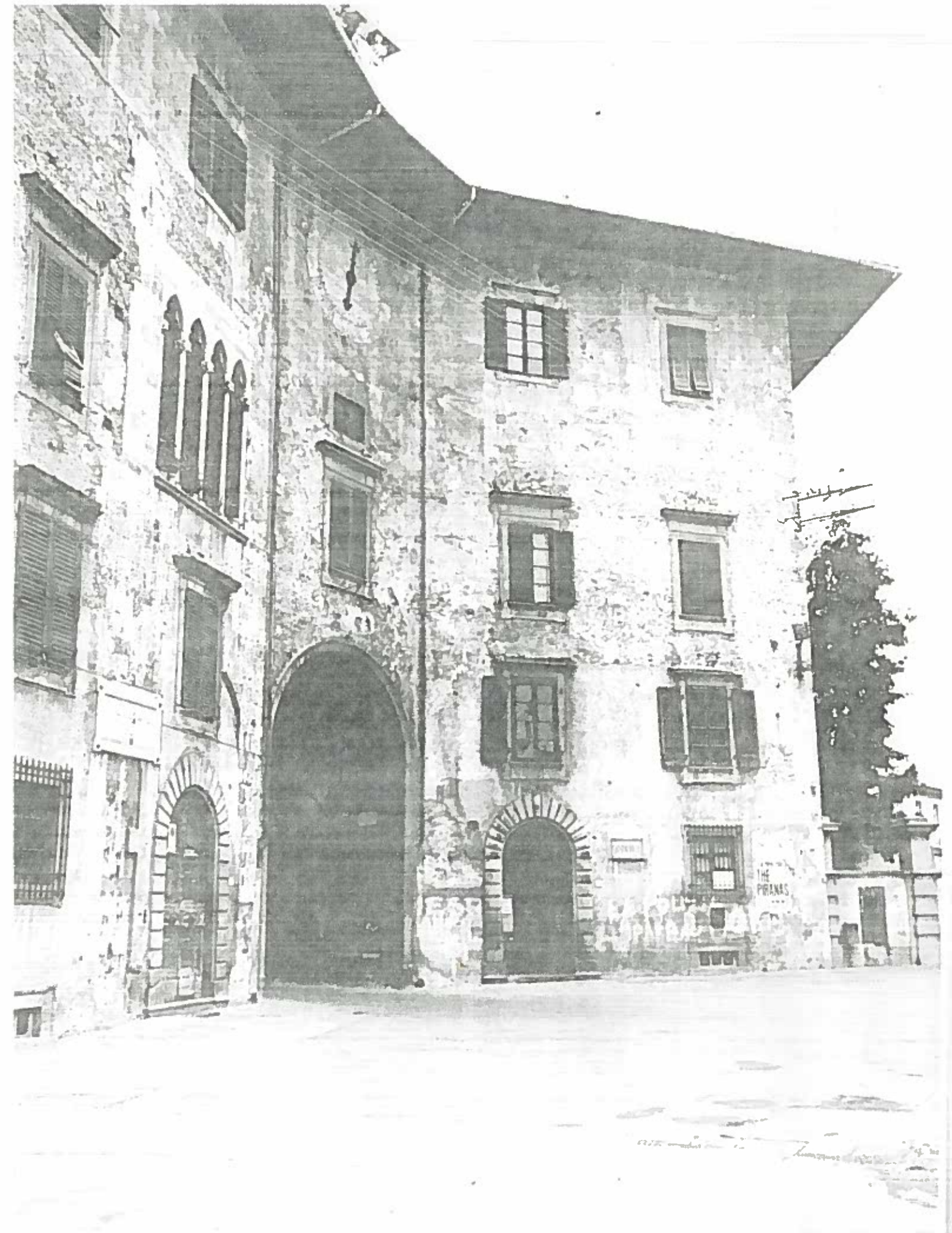
Piazza dei Cavalieri u/s (Palazzo dell'Orologio) Isolato 164/13 NEGATIVO 1911