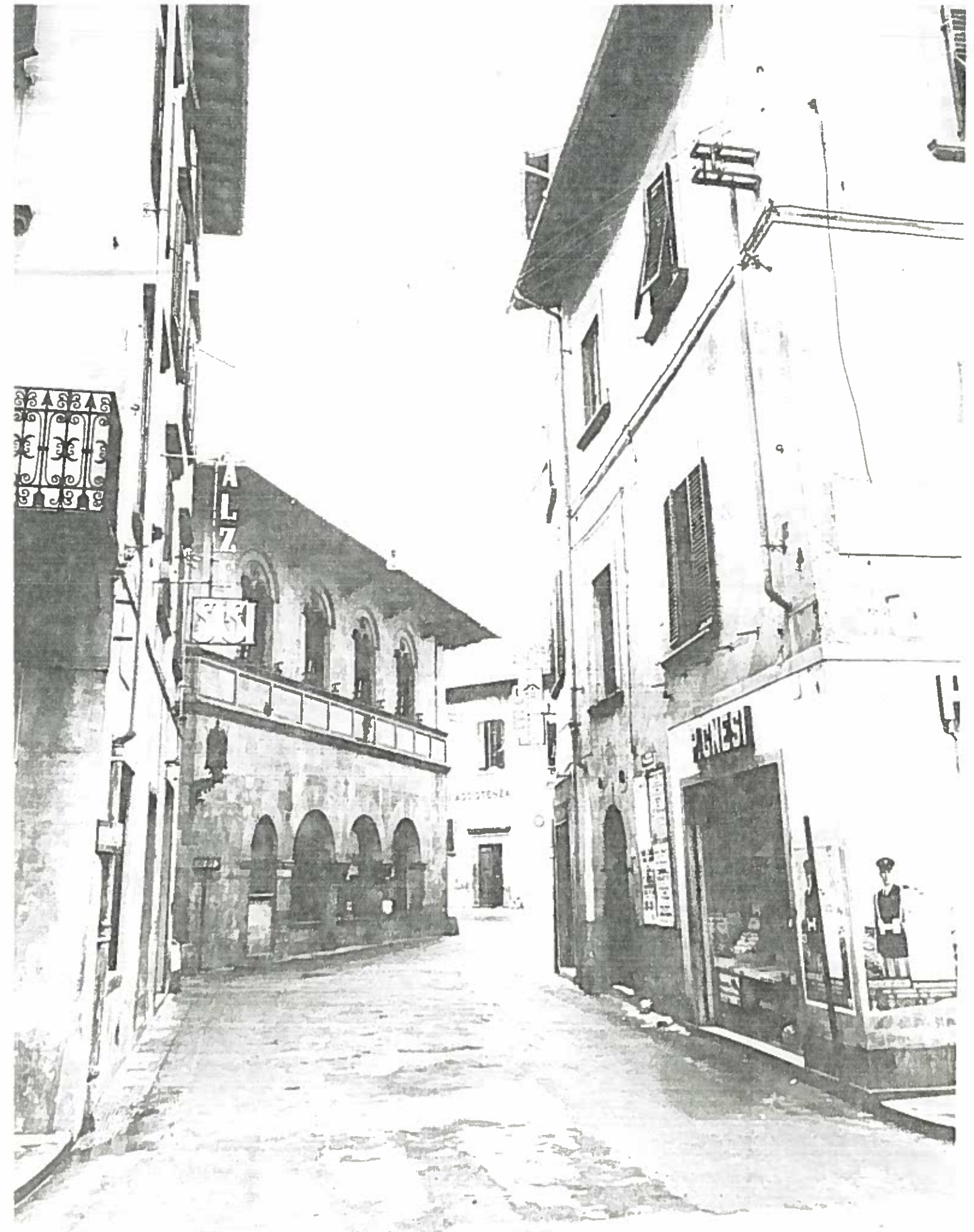
VIA DINA VEUTA ISOLA D'ISCHIA 190/2 NEGATIVO 19317