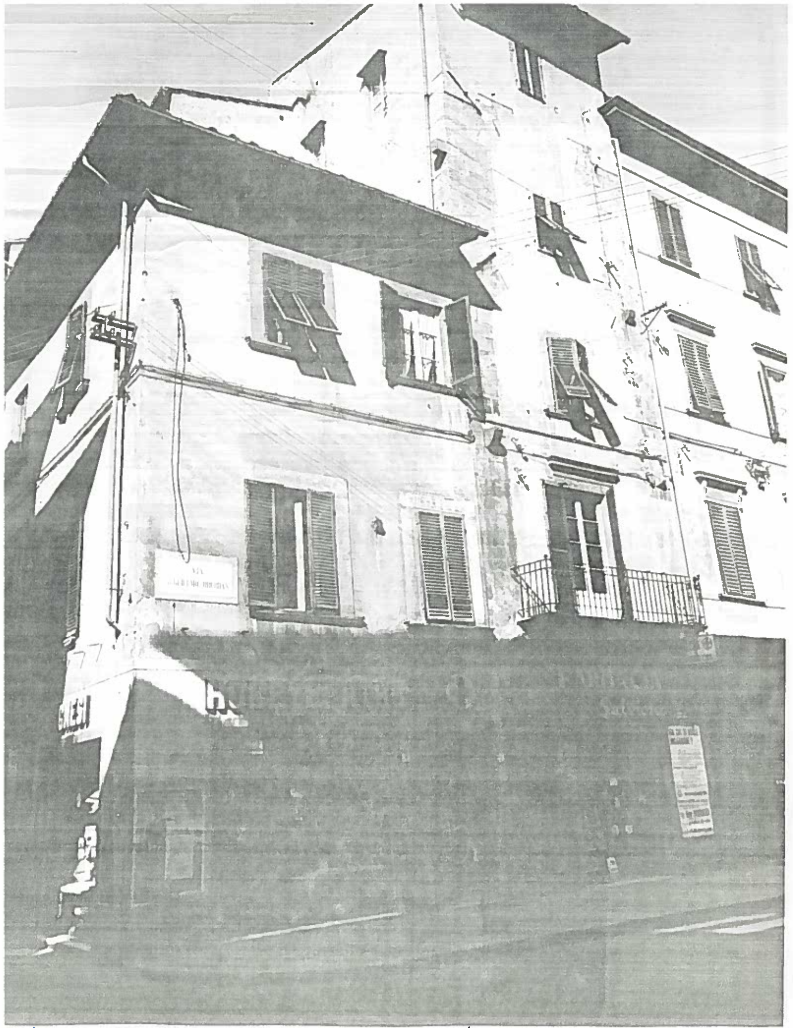
VIA OBERDAN 1/3