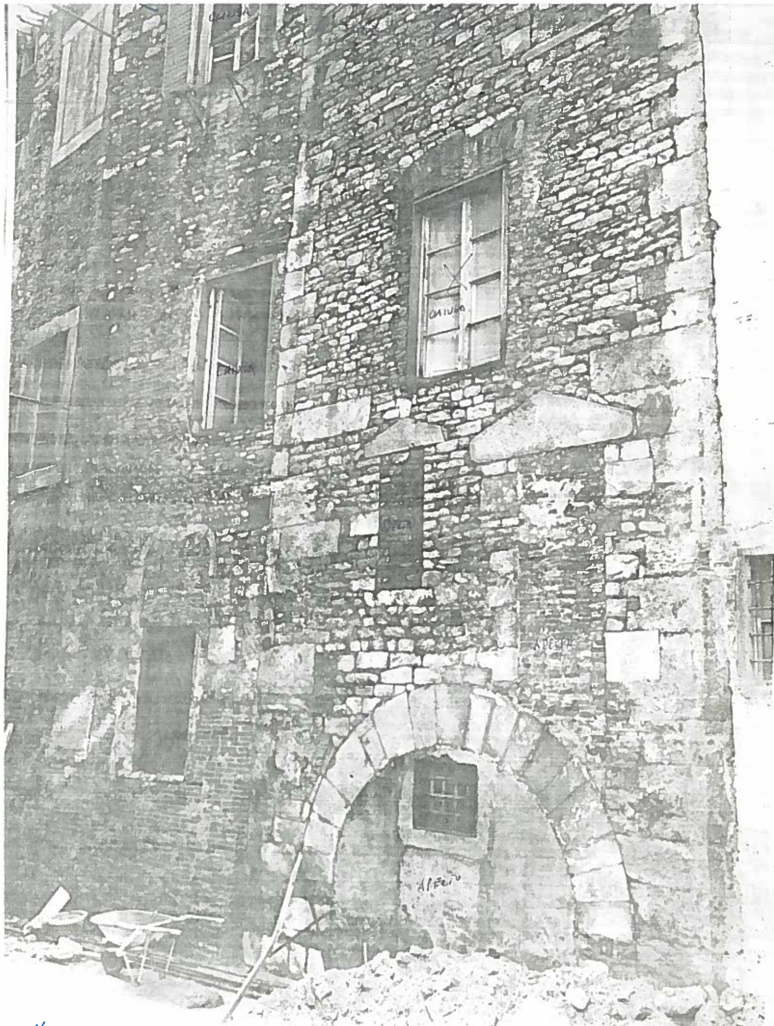
VIA DELLA SAPIENZA CORTILE INTERNO ISOLATO 65 NEGATIVO 18817