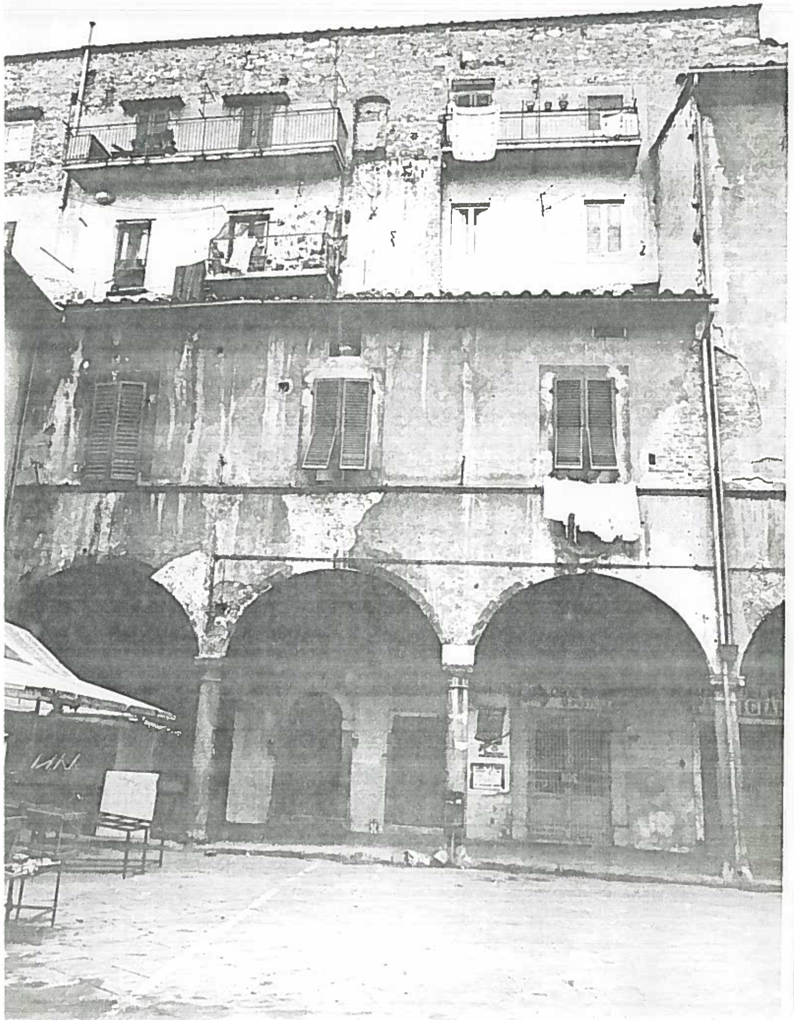
Pia delle Vettovaglie ISOLATO 89203/14 Negat. 18496