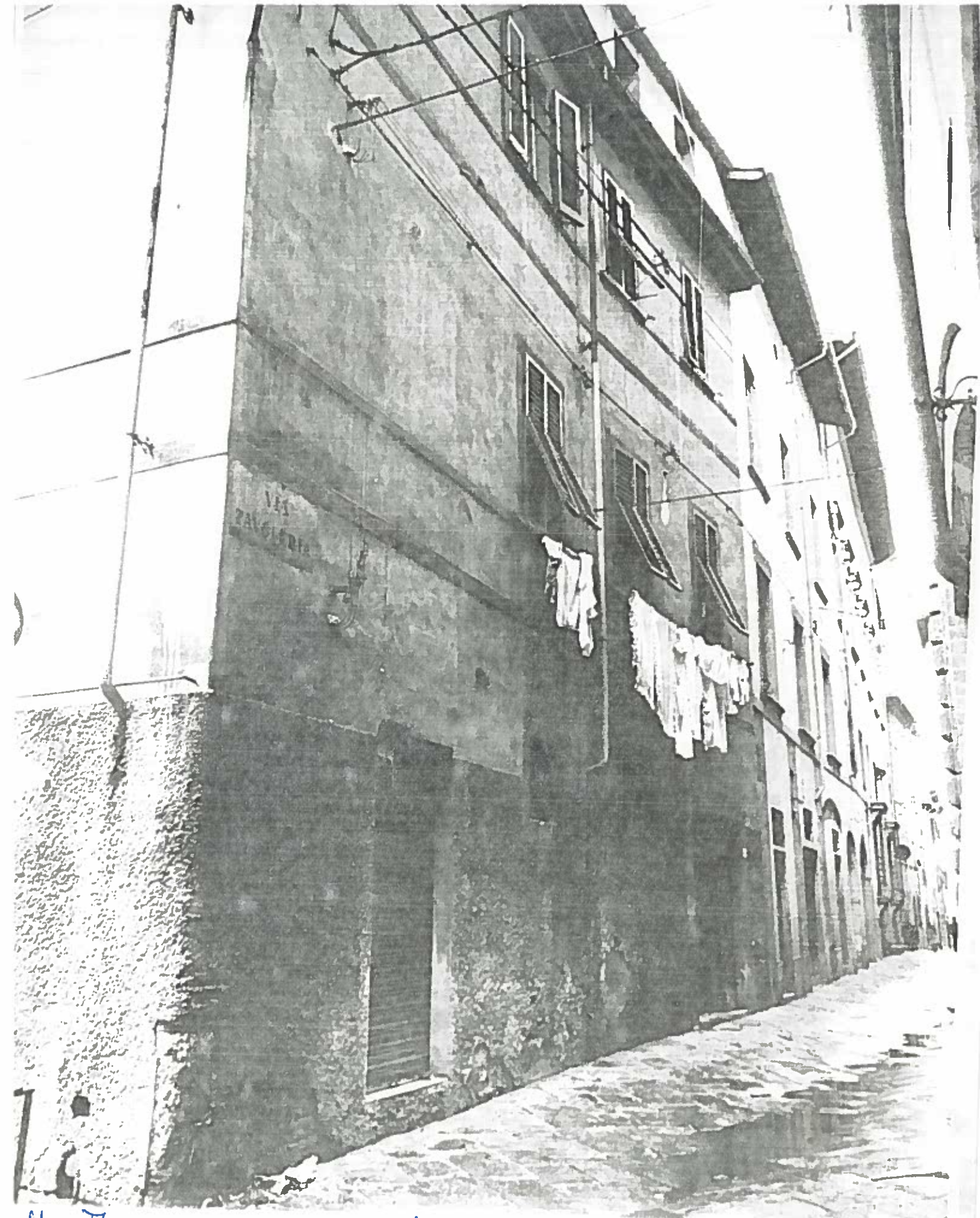
VIA TABLERIA DAL 1 AL 9