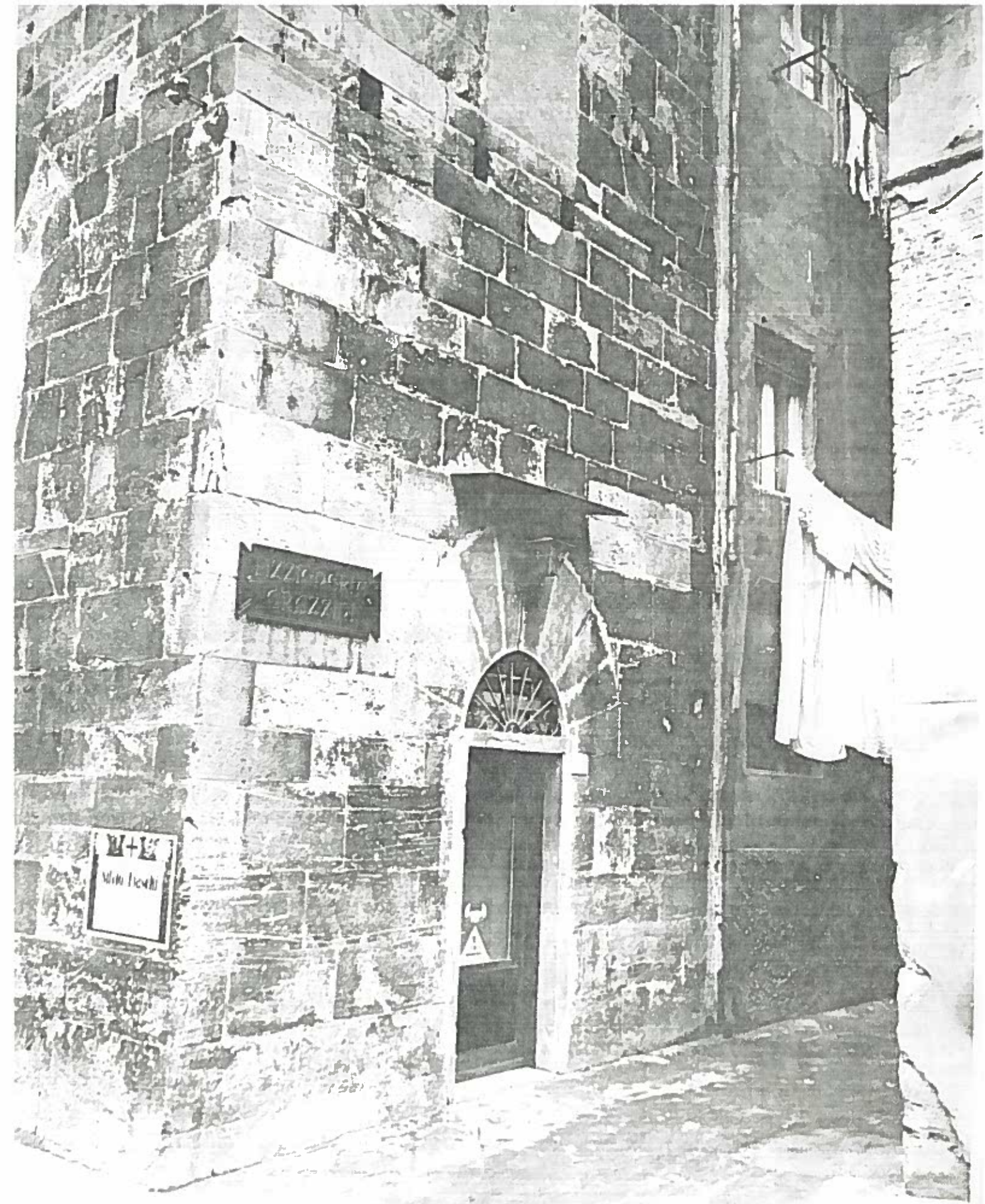
VIA D. CAVALCA TORRE PARTE INF. RE ISOLATO 194 194/7 NEGATIVO 19308