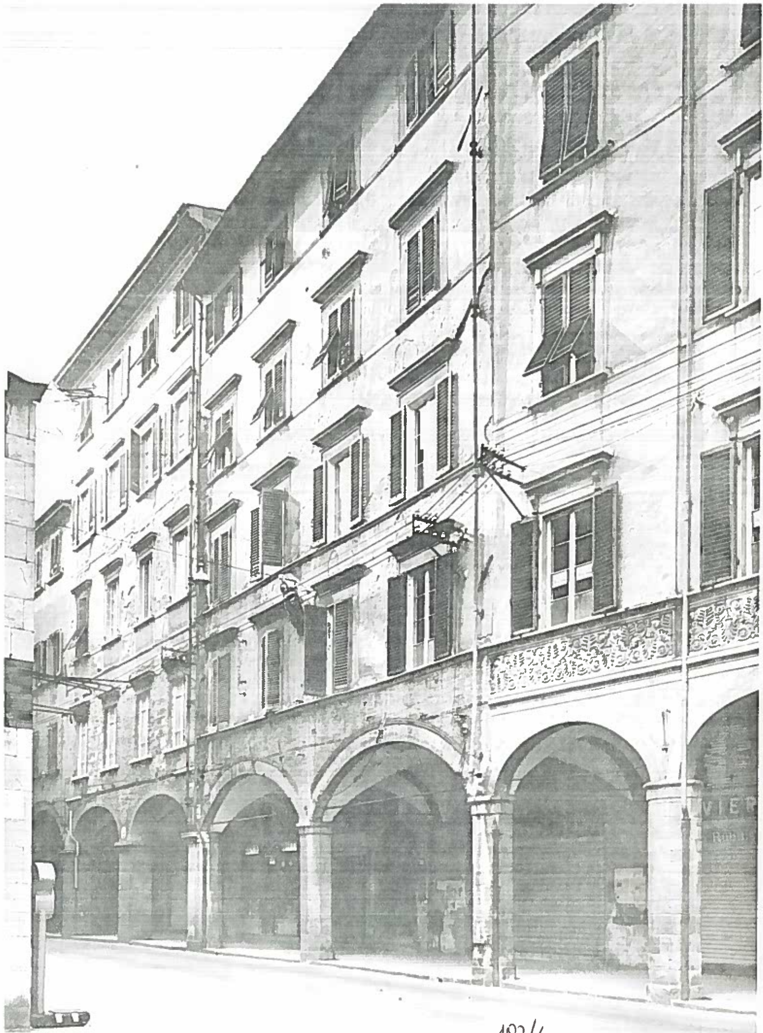
BORGIO STRETTO N° 33-35-37-39 ISOLATO 197/6 NEGATIVO 13580