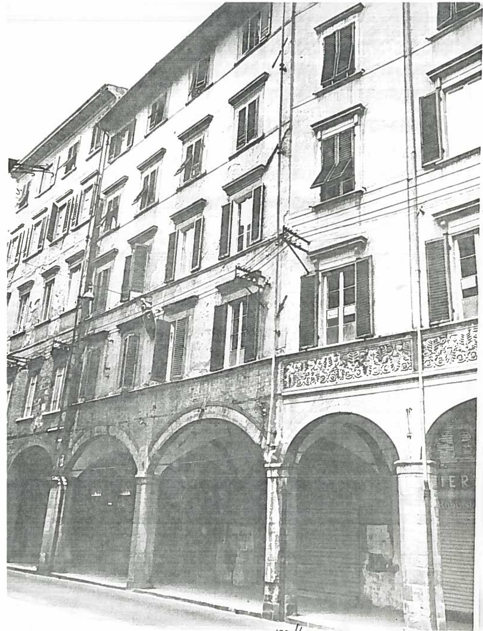
Borgo STRETTO dal 31 al 37 ISOLATO C. 197/6 Negativo 18592