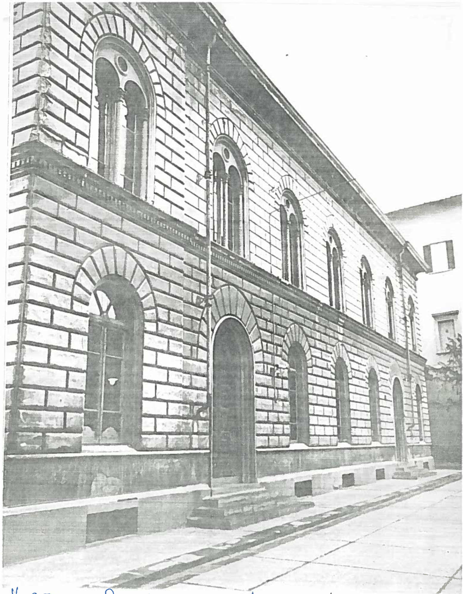
VIA S. FREDIANO SCUOLE ELEMENTARI