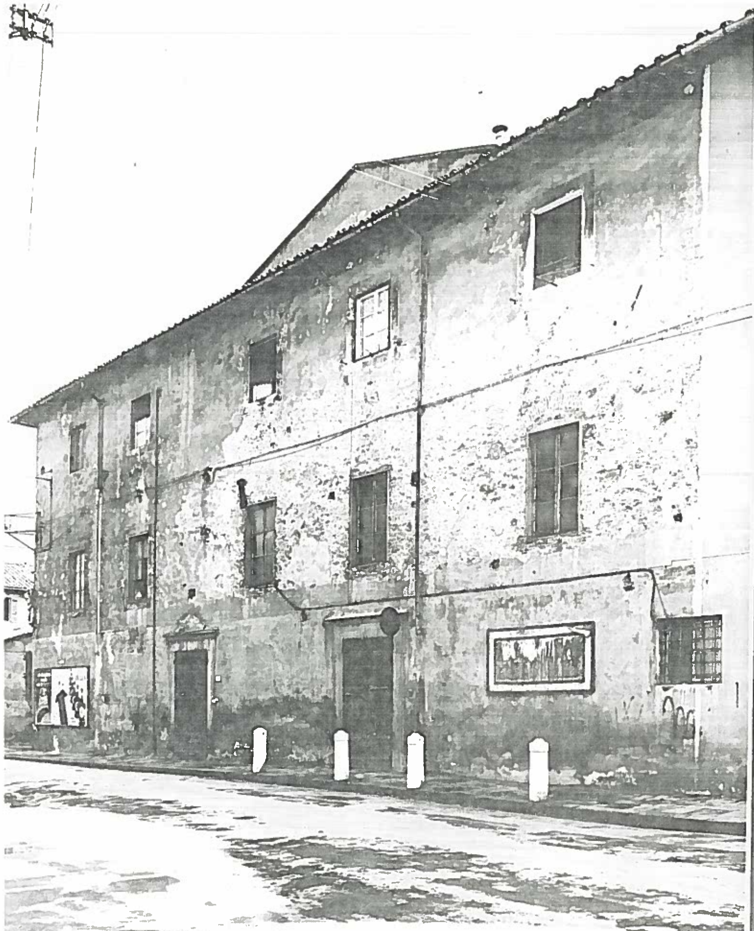
VIA DEL CONEGGIO RICCI TEATRO ROSSI