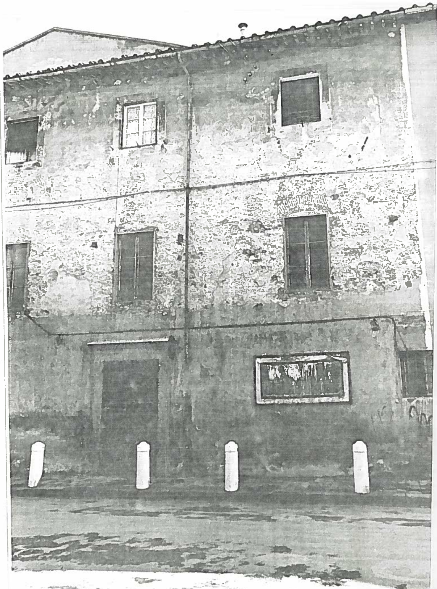
VIA CONEGIO RICCI (EX TEATRO ROSSI) | SOLATO 66 | NEGATIVO 197