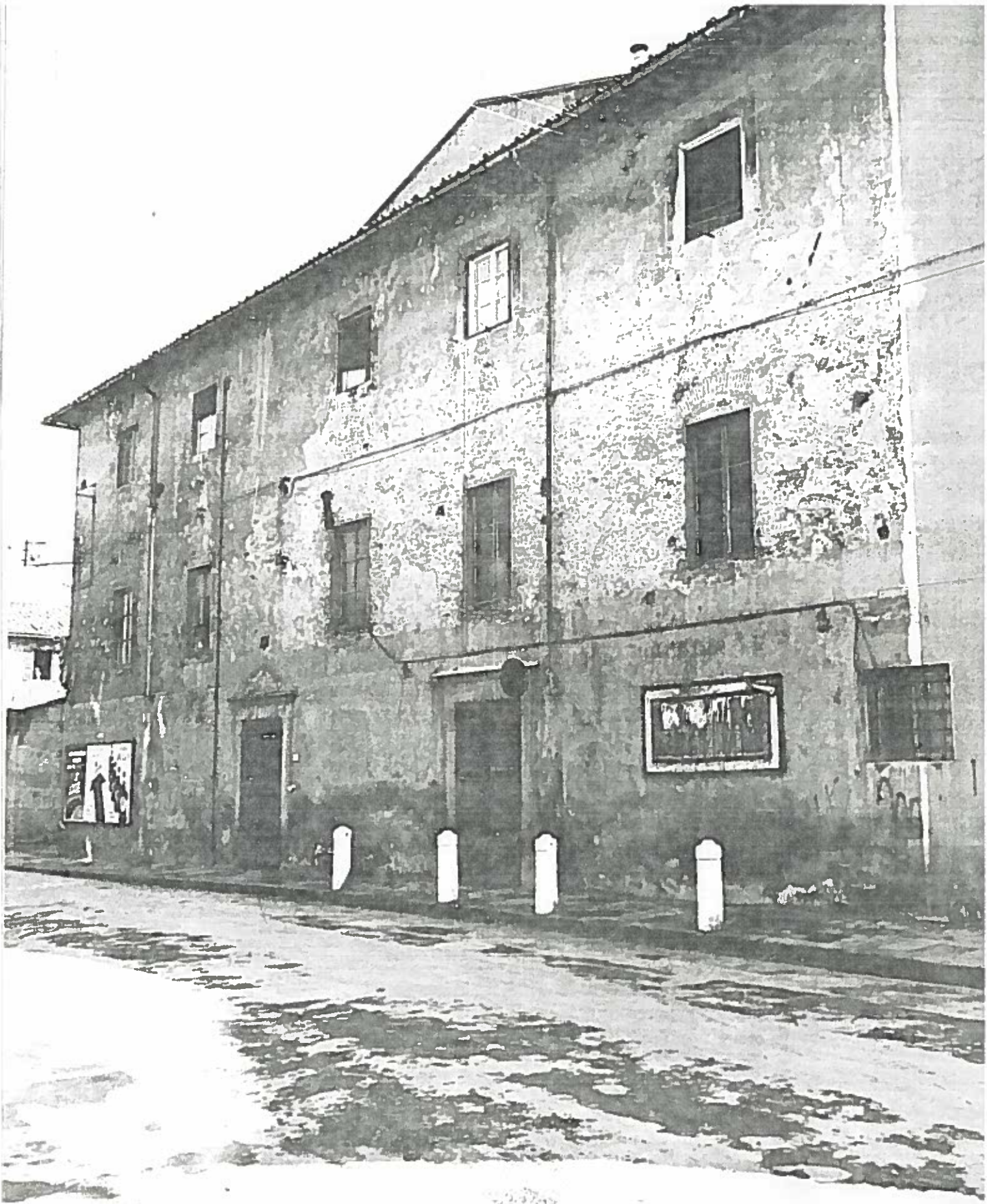
VIA CONEGIO RICCI (EX TEATRO ROSSI)