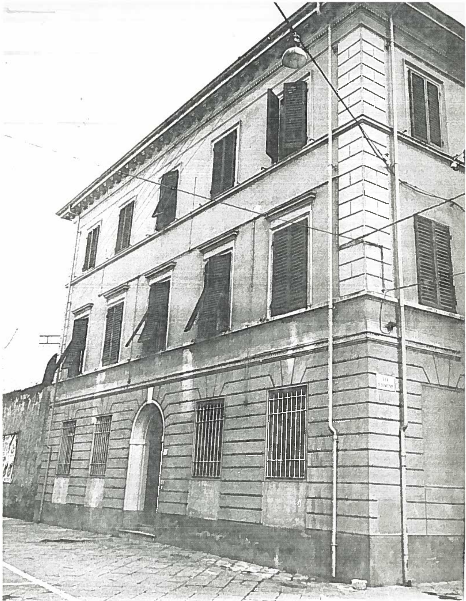
P. 222A TORRICELLI 4