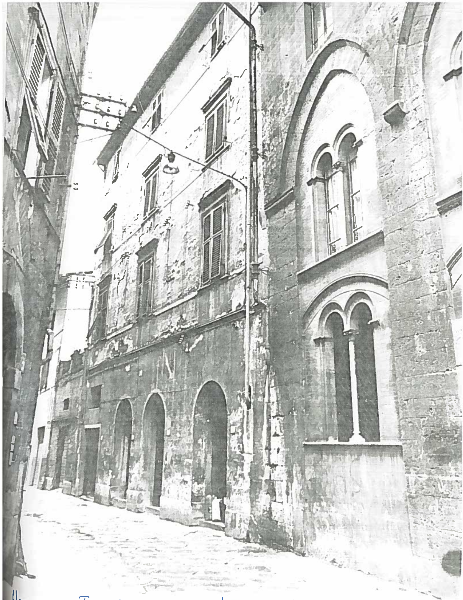
VICOLO DEL TIDI DAL 11 AL 21 ISOLAURO 198/2 NEGATIVO 19302