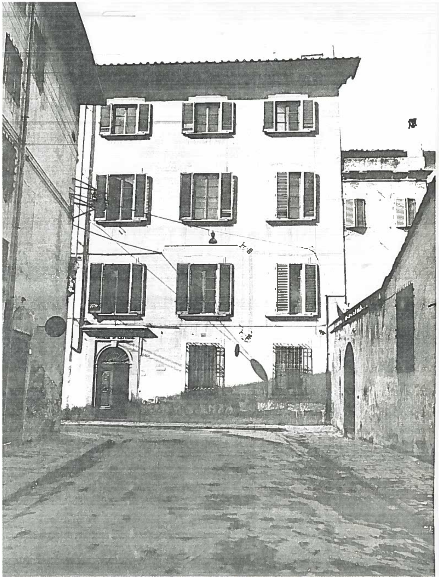
VIA DEL CONGREGIO RICCI VENTATA FACCIATA DI LETTERE ISOLATO 61 NEGATIVO 18908