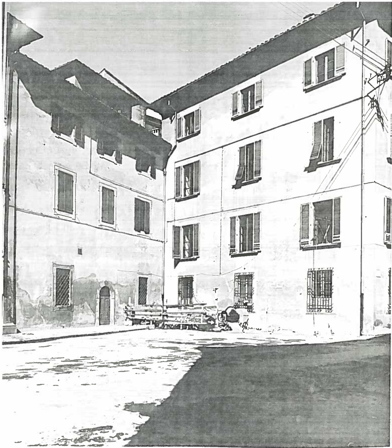
P.zza Casanova Fianco Consiglio Ricci