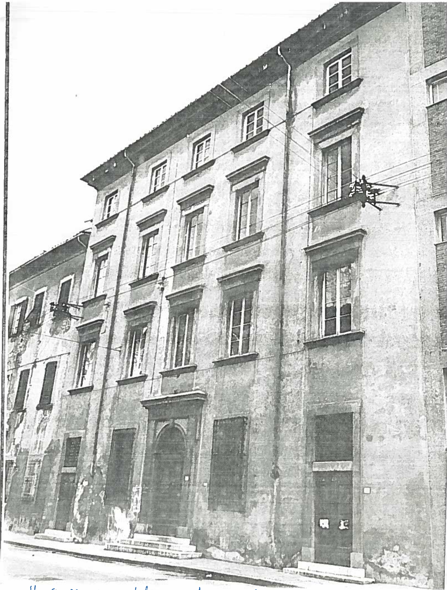
VIA S. MARIA 6/8/10 ISCARO 61 NEGATIVO 18174