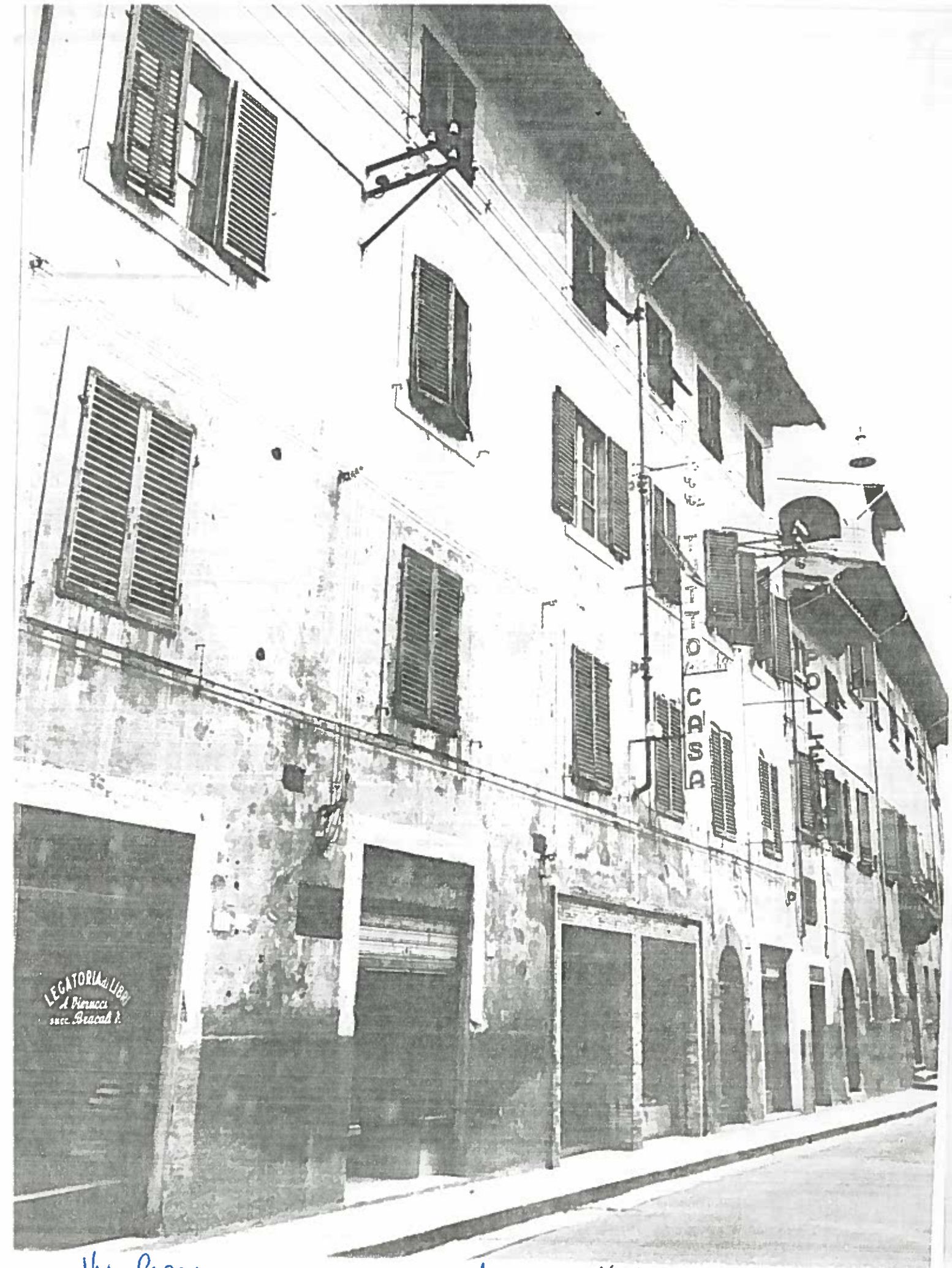
VIA CARACCI DAL 11 AL 19 ISOLATO 167/2 NEGATIVO 20293