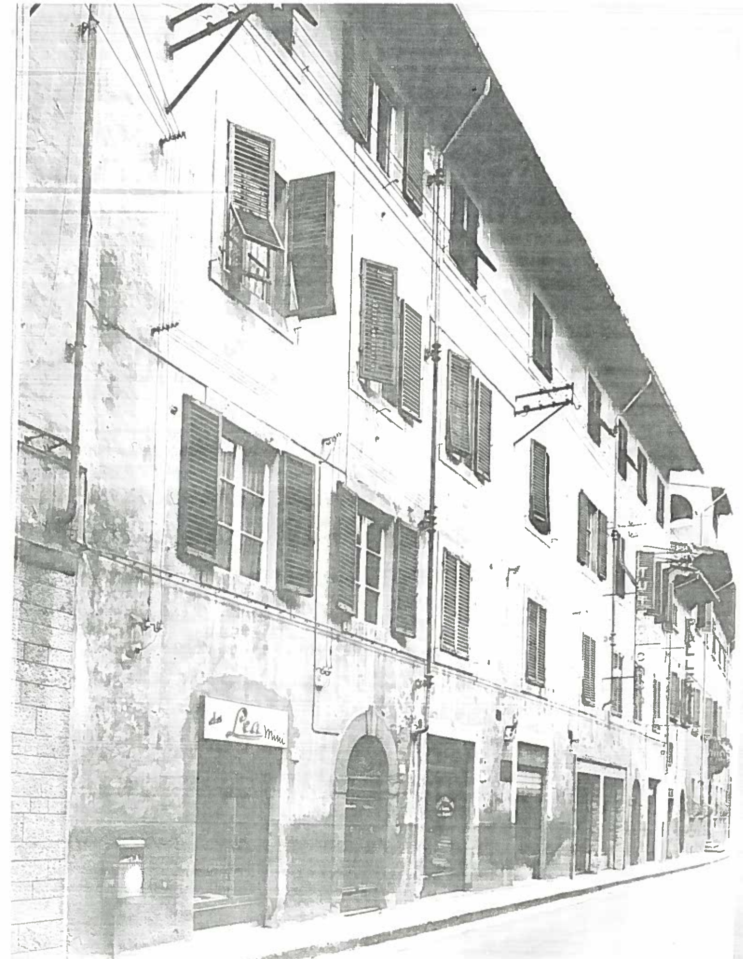
VIA CAROVCI DAL 7 AL 13 ISOLATO 4/67/2 NEGATIVO 13616