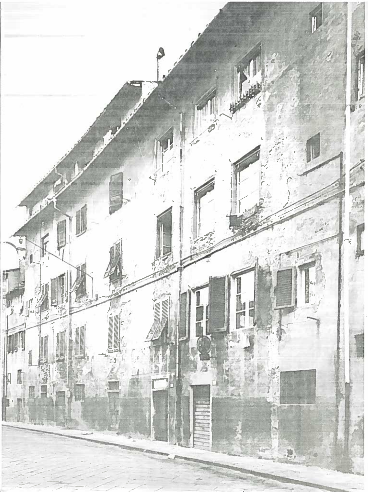
VIA S. APOLLONIA DAL 6 AL 12