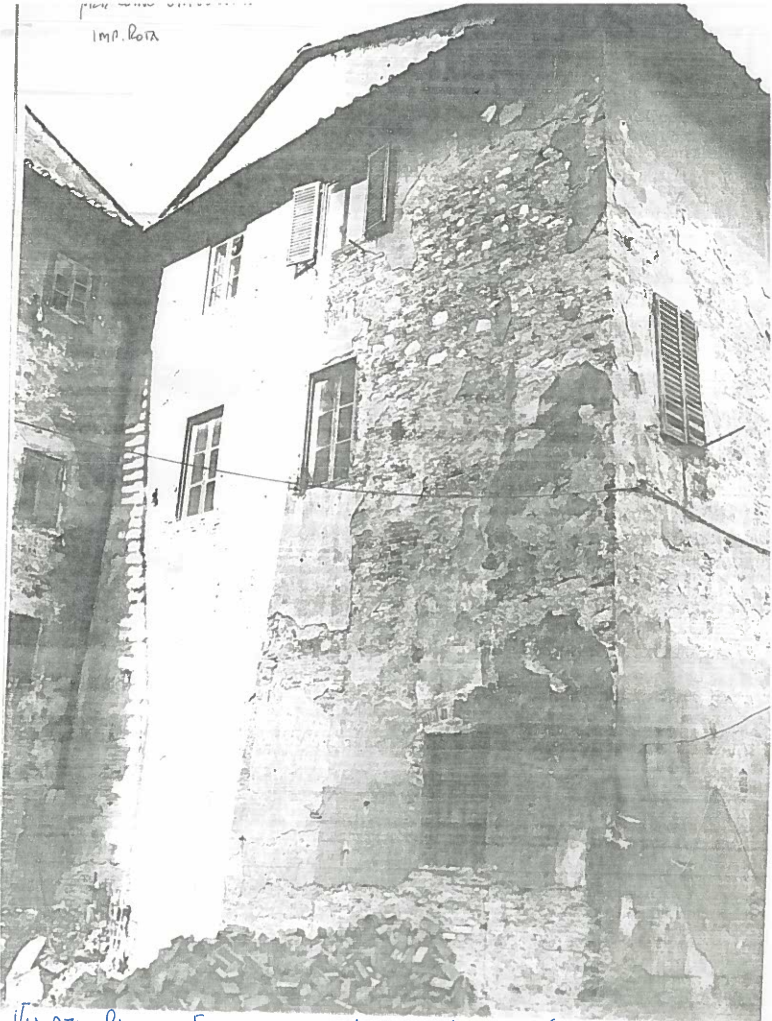
VIA DEUA SAPIENZA EDIFICIO SU CORTINE INTERNO ISOLATO 65. NEGATIVO 18815