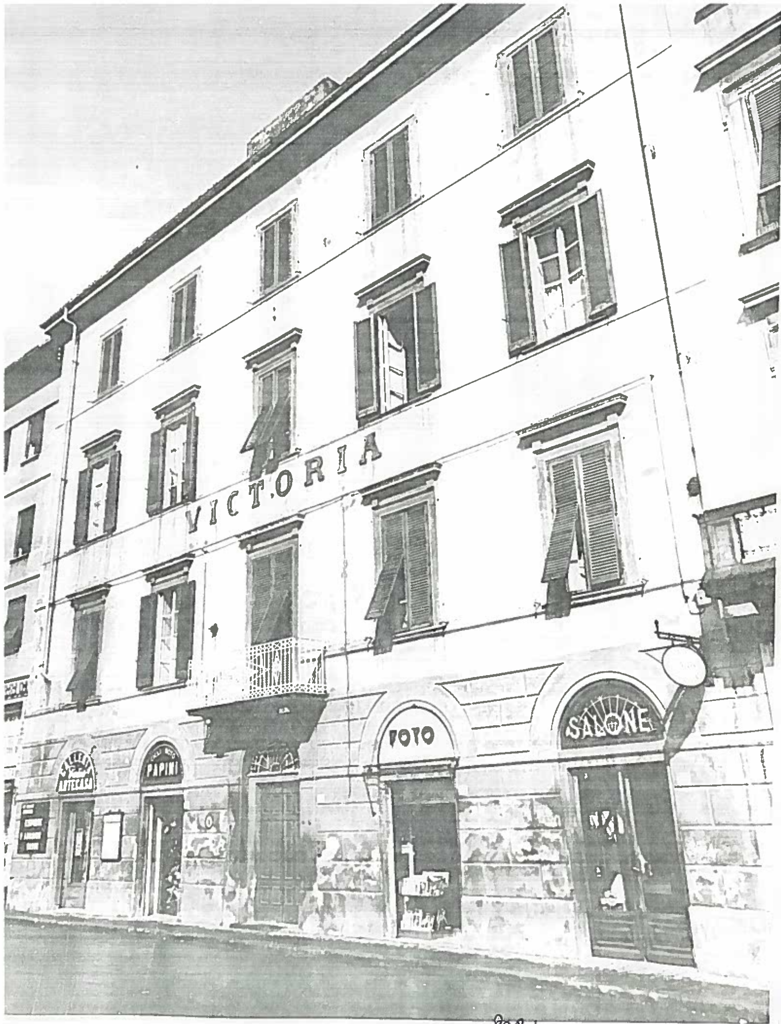
lung. Pacinotti dal 16 al 20