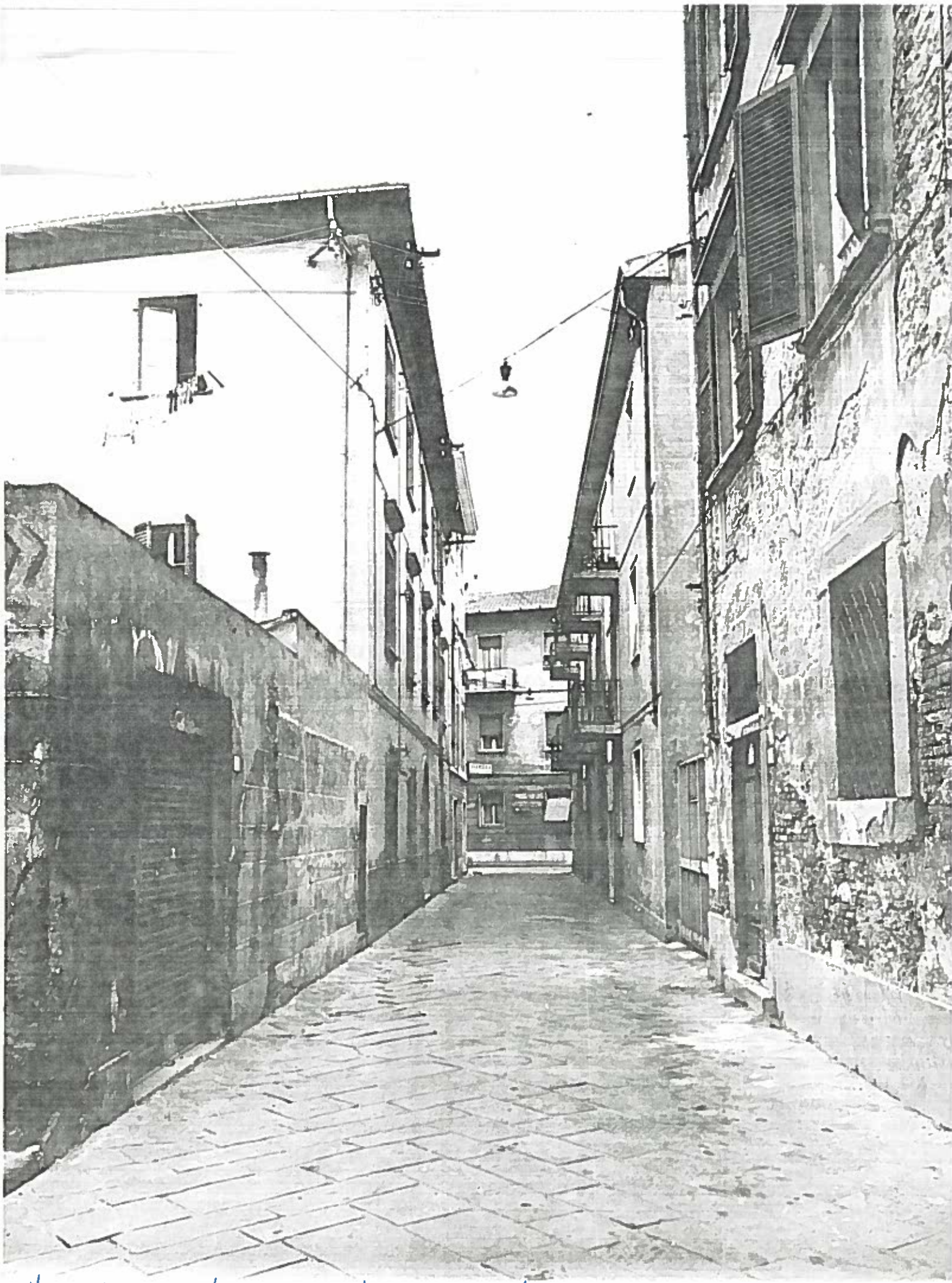
VIA S. LUCA VEDUTA ISOUATI 51/52 NEGATIVO 19704