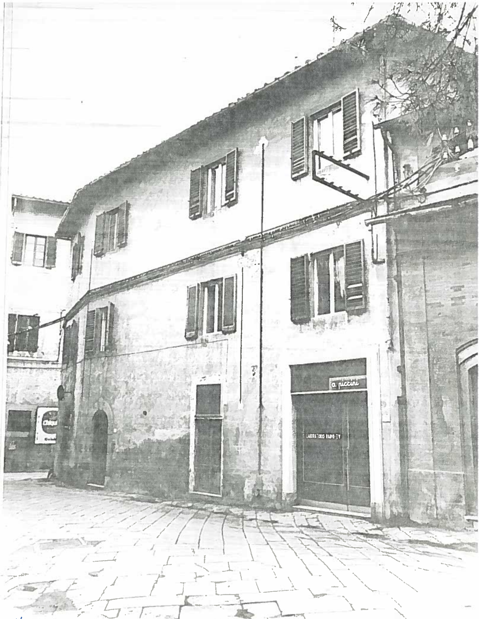
VIA RONSON DEL MARE 11/3/57 15047 190/11 NEGATIVO 19360