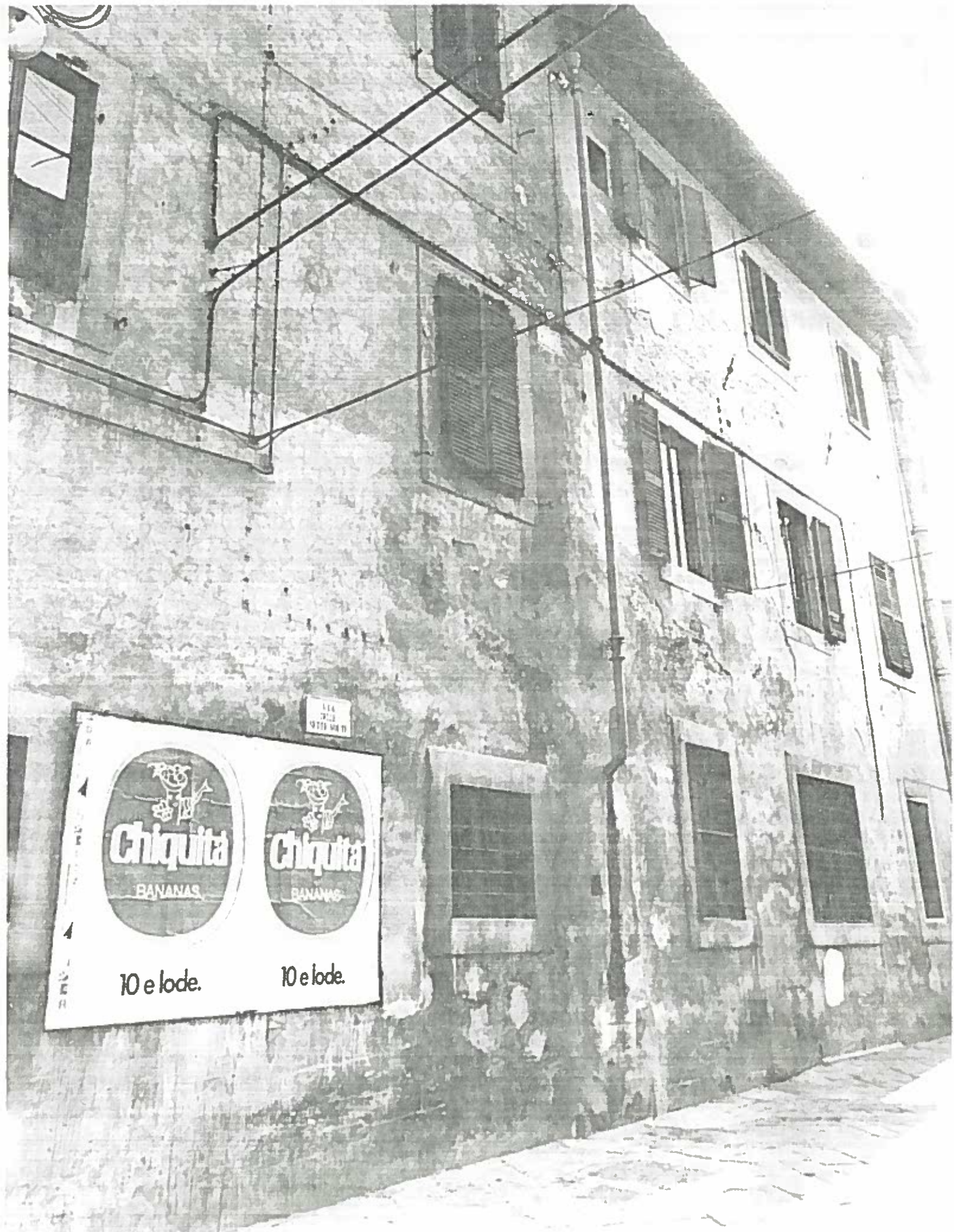
VIA DELLE 7 VOLTE (317) ISOATO 490/6 NEGATIVO 19484