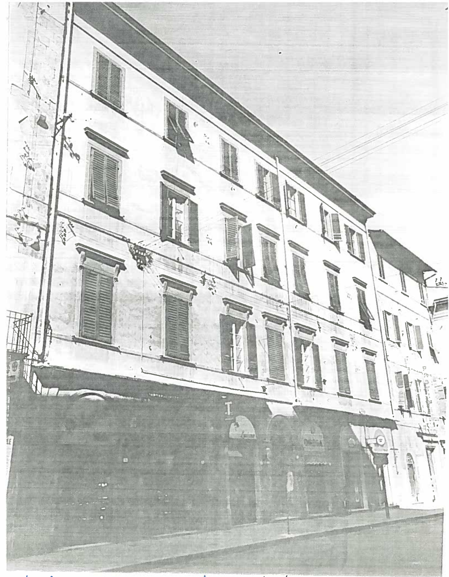
VIA OBERDAN DAL 5 AL 17 ISOLATO 190/6 NEGATIVO 19447