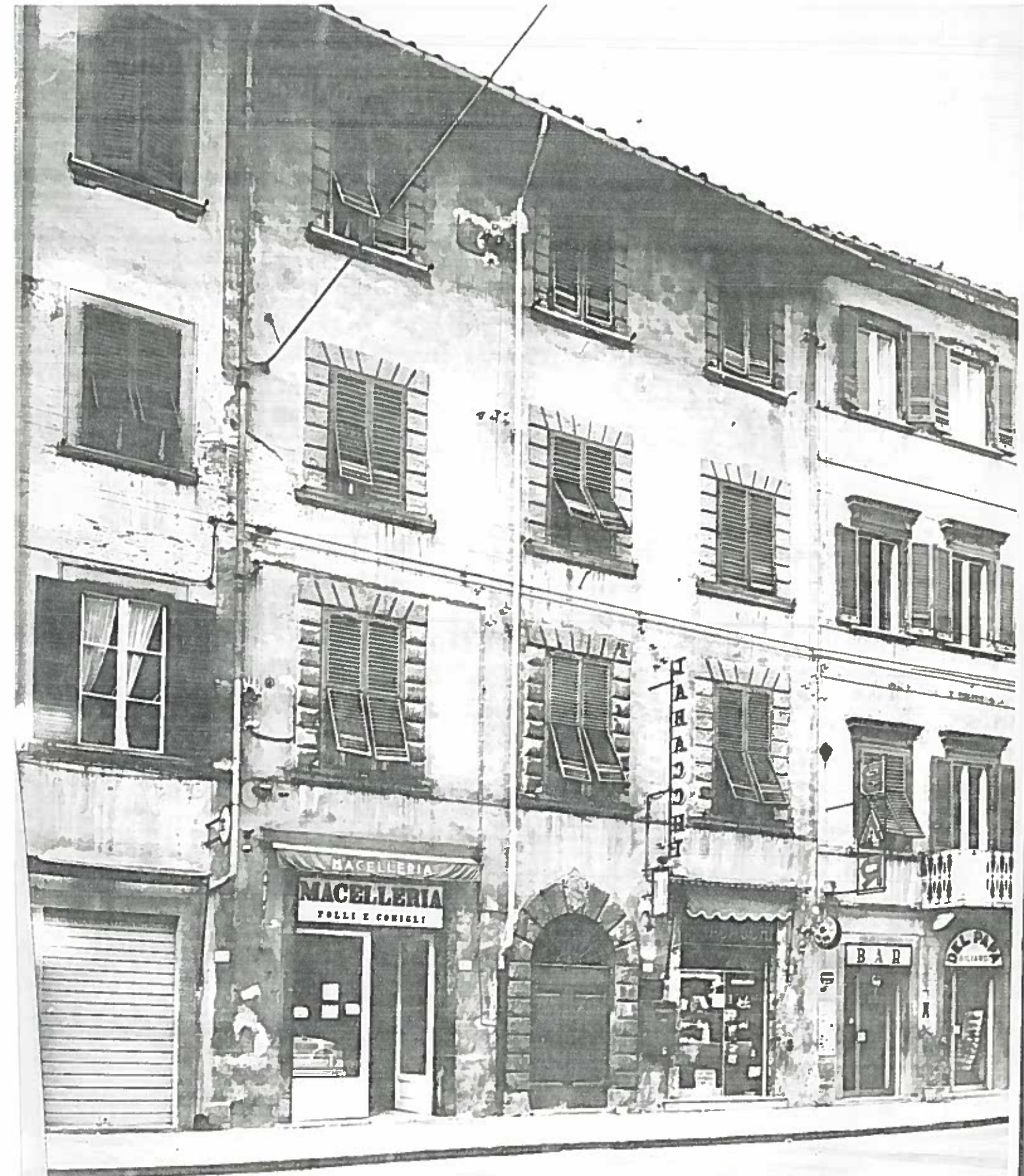
VIA S. MARIA DAL 103 AL 109 ISOLATO 55 NEGATIVO 13999