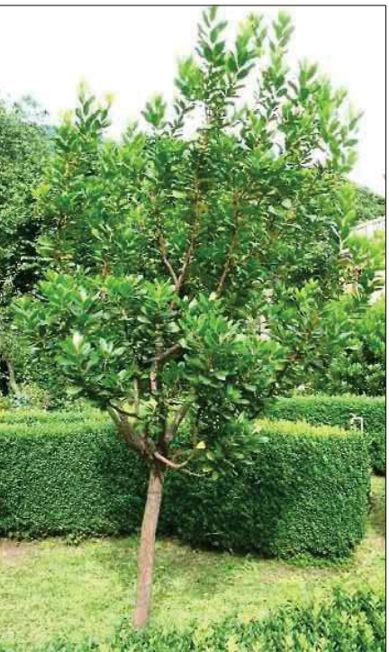
Arbutus unedo Corbezzolo