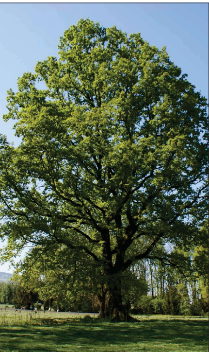
Quercus robur Quercia