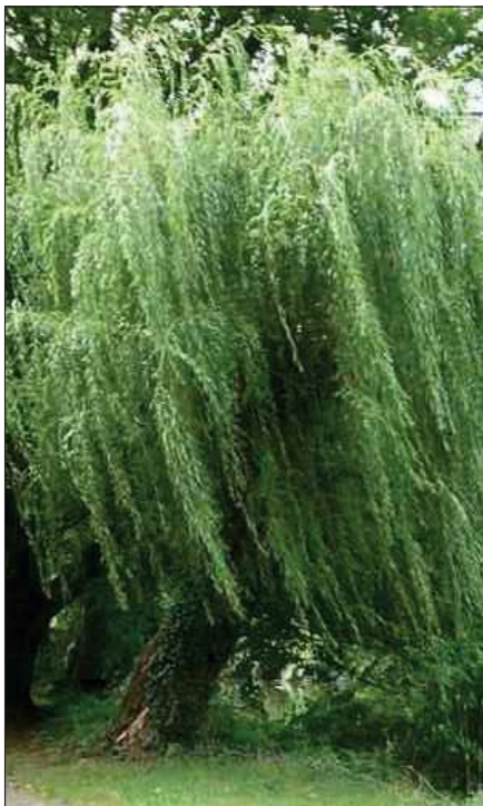
Salix alba Salice bianco