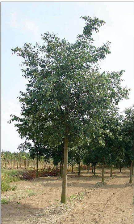
Celtis australis Bagolaro