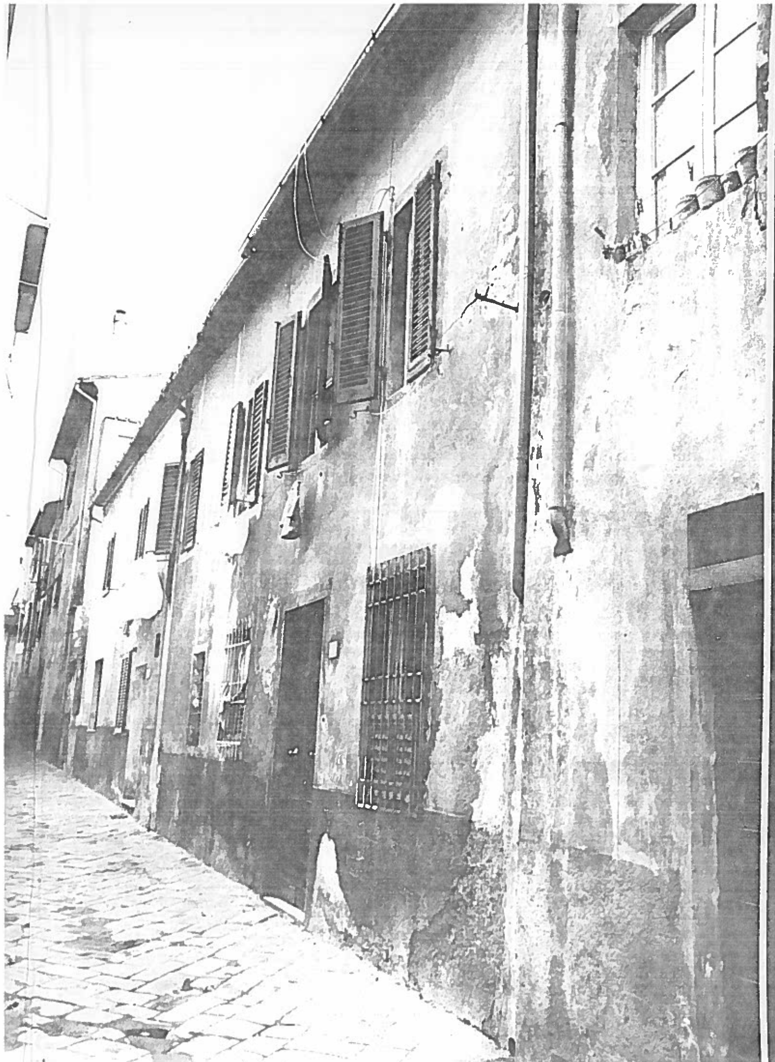
Vicolo S. Cosimo 5/7 ISOLATO 42 NEGATIVO 20330