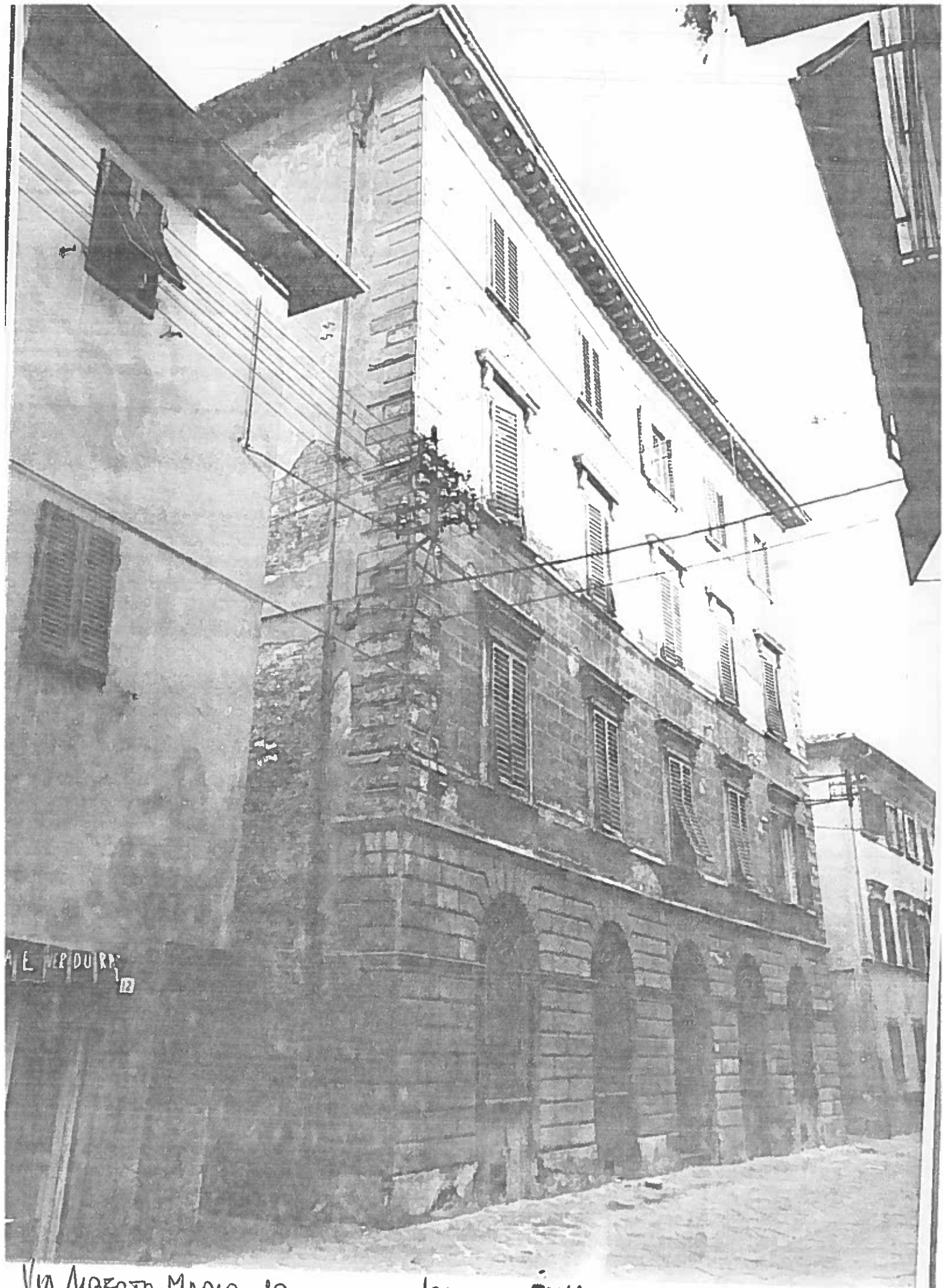
VIA AUBERTO MARCO 10