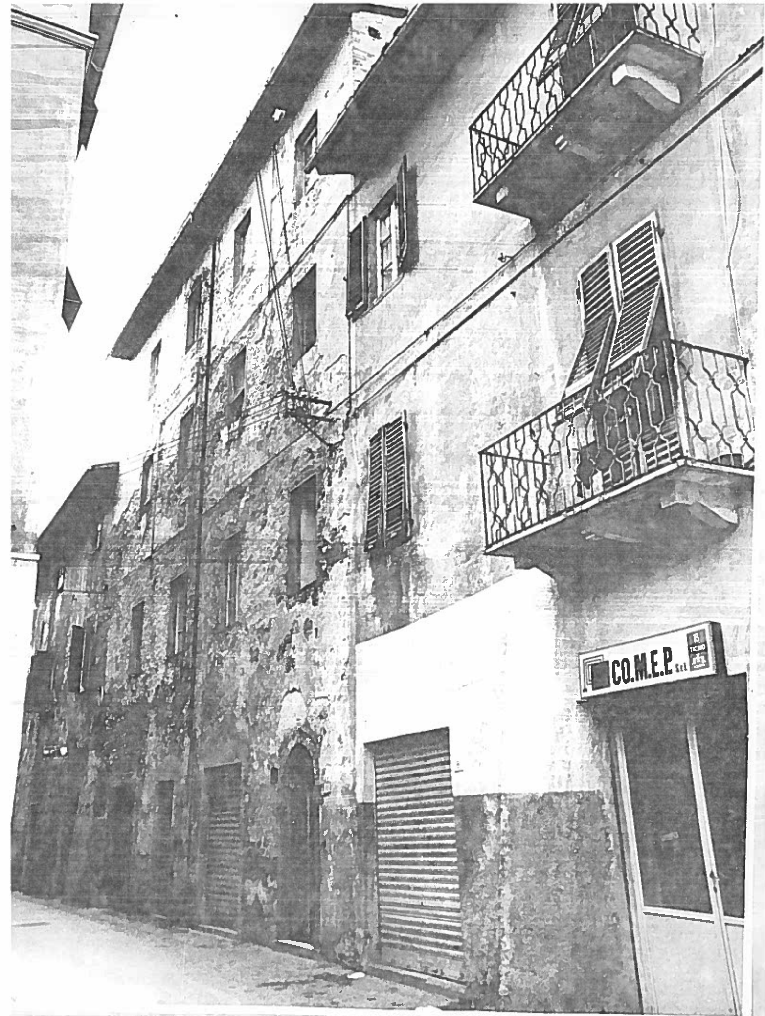
Via dei Facchin da 89 18 ISOLATO 48/2 Nap. 19954