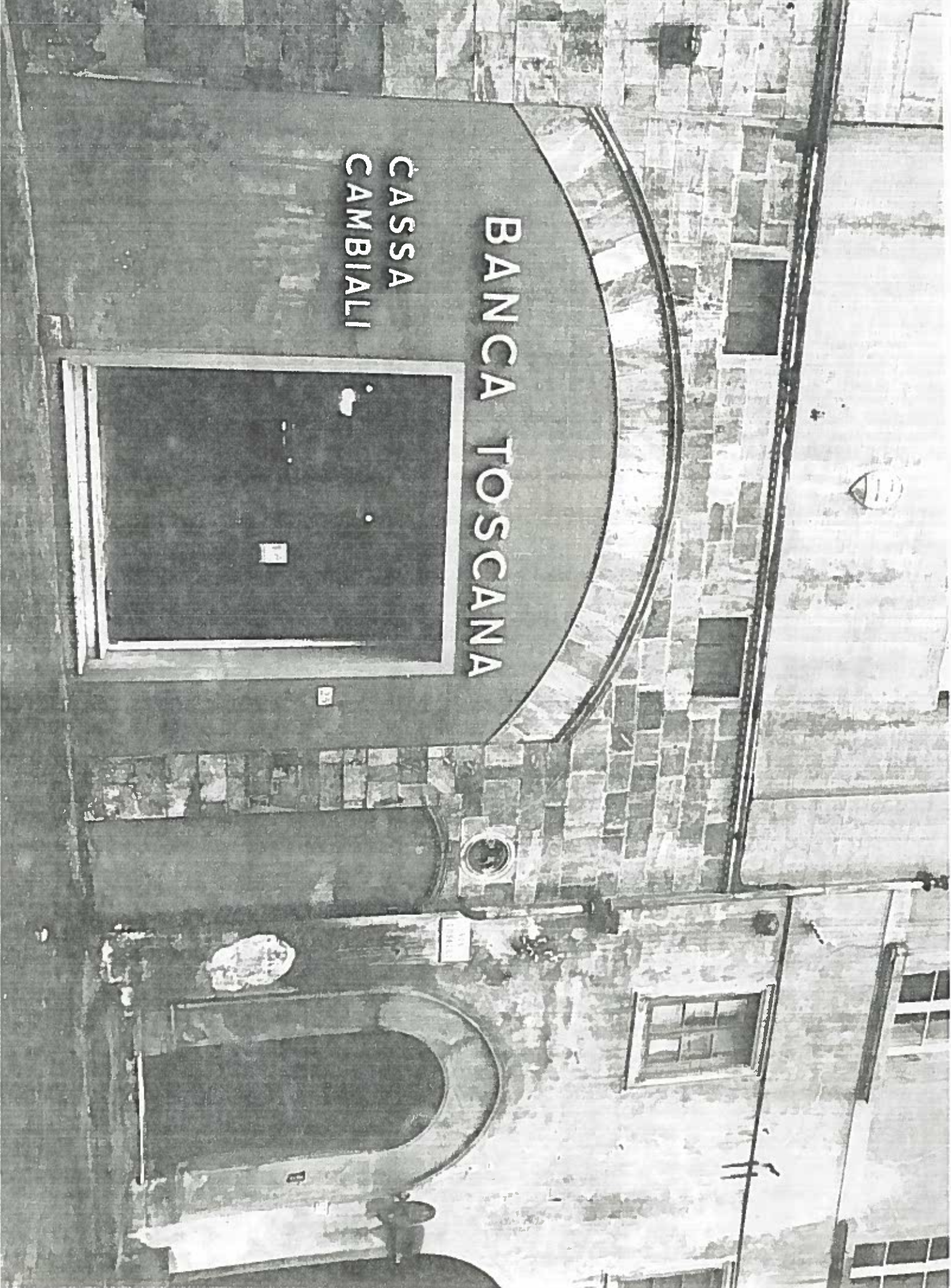
VA TOSCELLI n° 25 PARTICOLARE - ISOLATO n.° 38/2