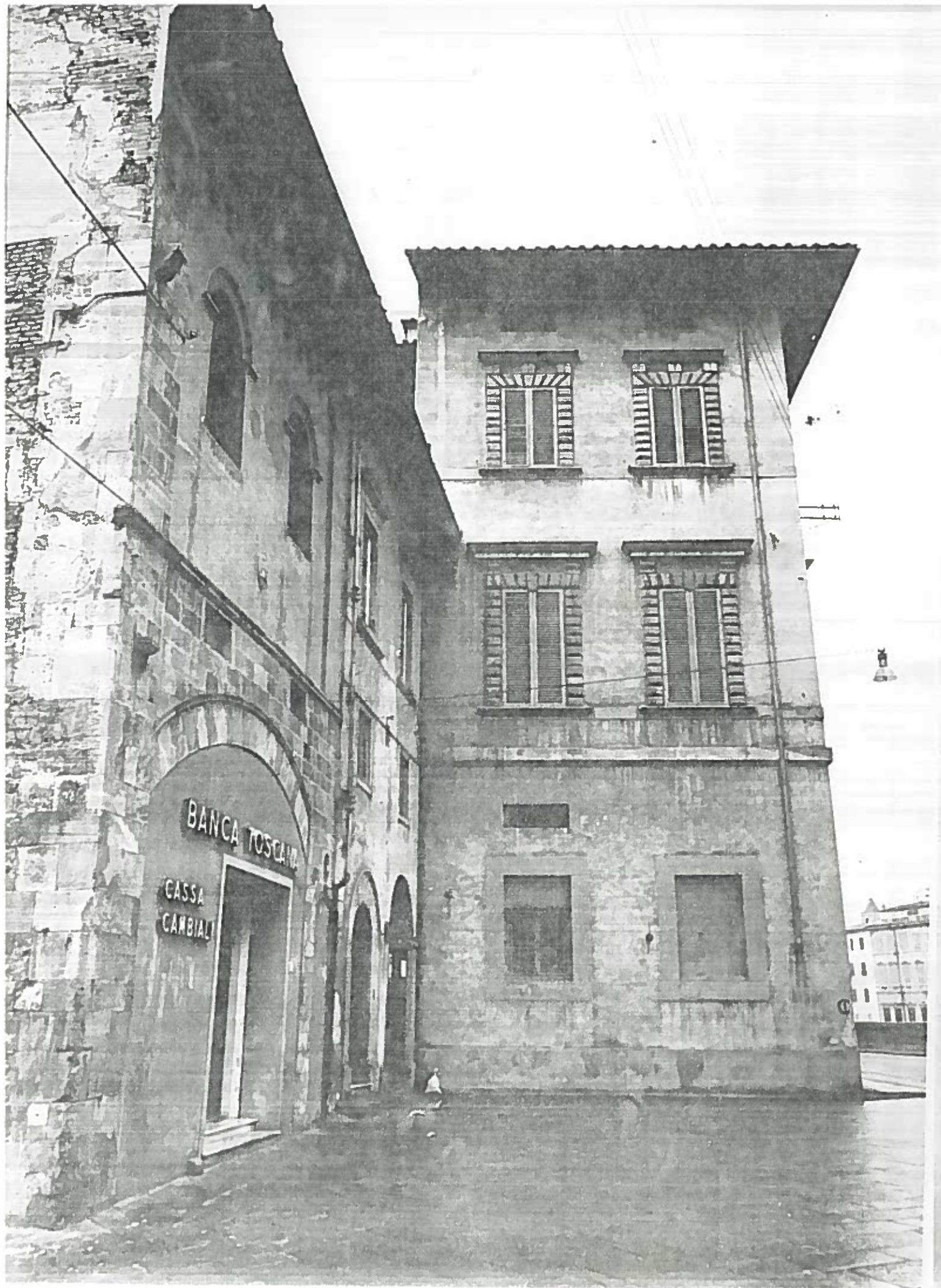
11A TOSELLI n° 27-29 ISOLATO 38/2 19250