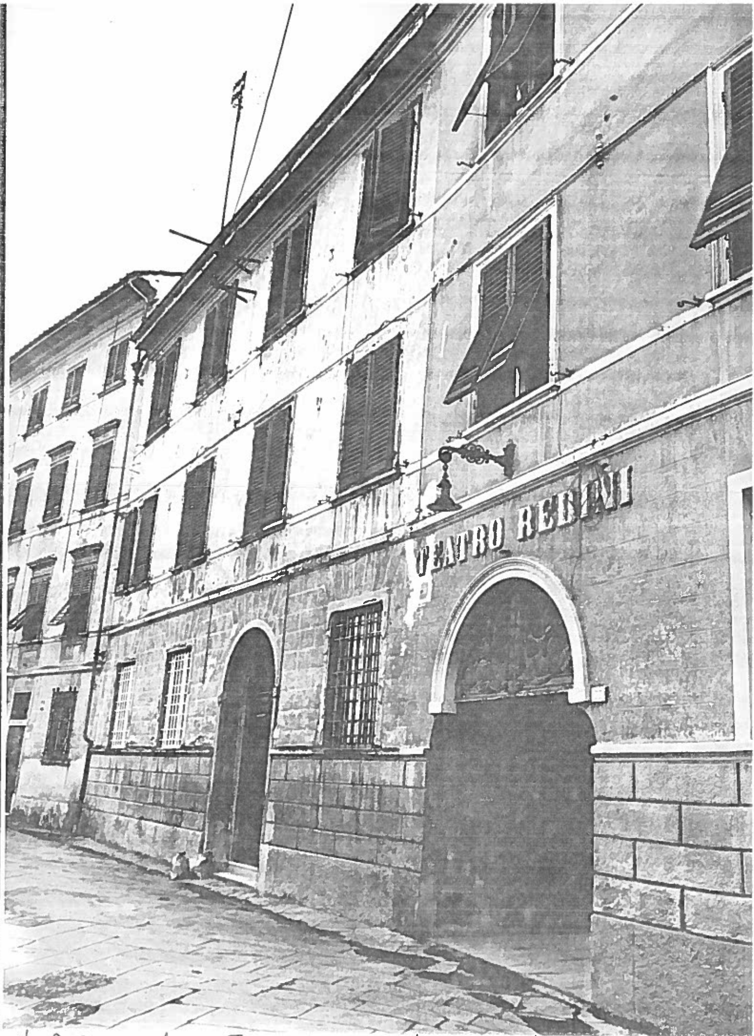
VIA P. GOETI 31/33 TEATRO REDINI | SOVRATO 79/19 NEGATIVO 17970