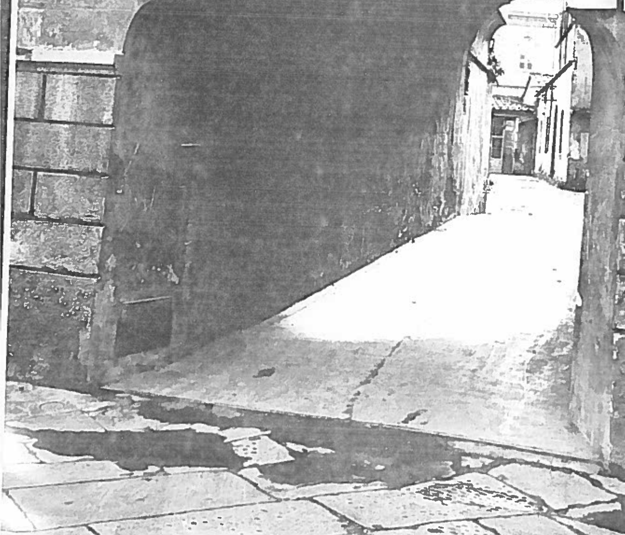
VIA P. GORI INGRESSO TEATRO REDINI