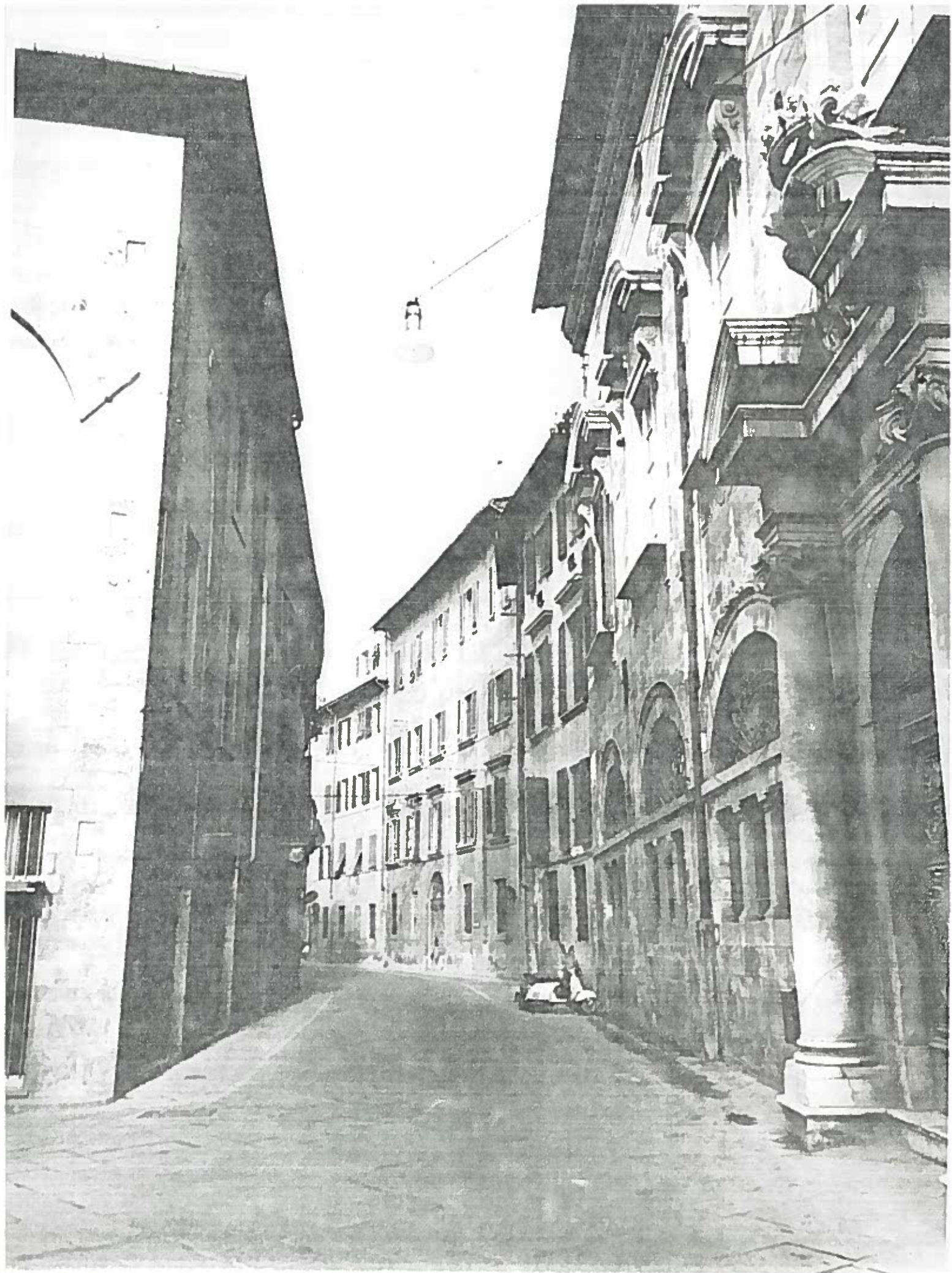
VIA TOSELLI - VEDUTA - ISOLATO 40/1 20072