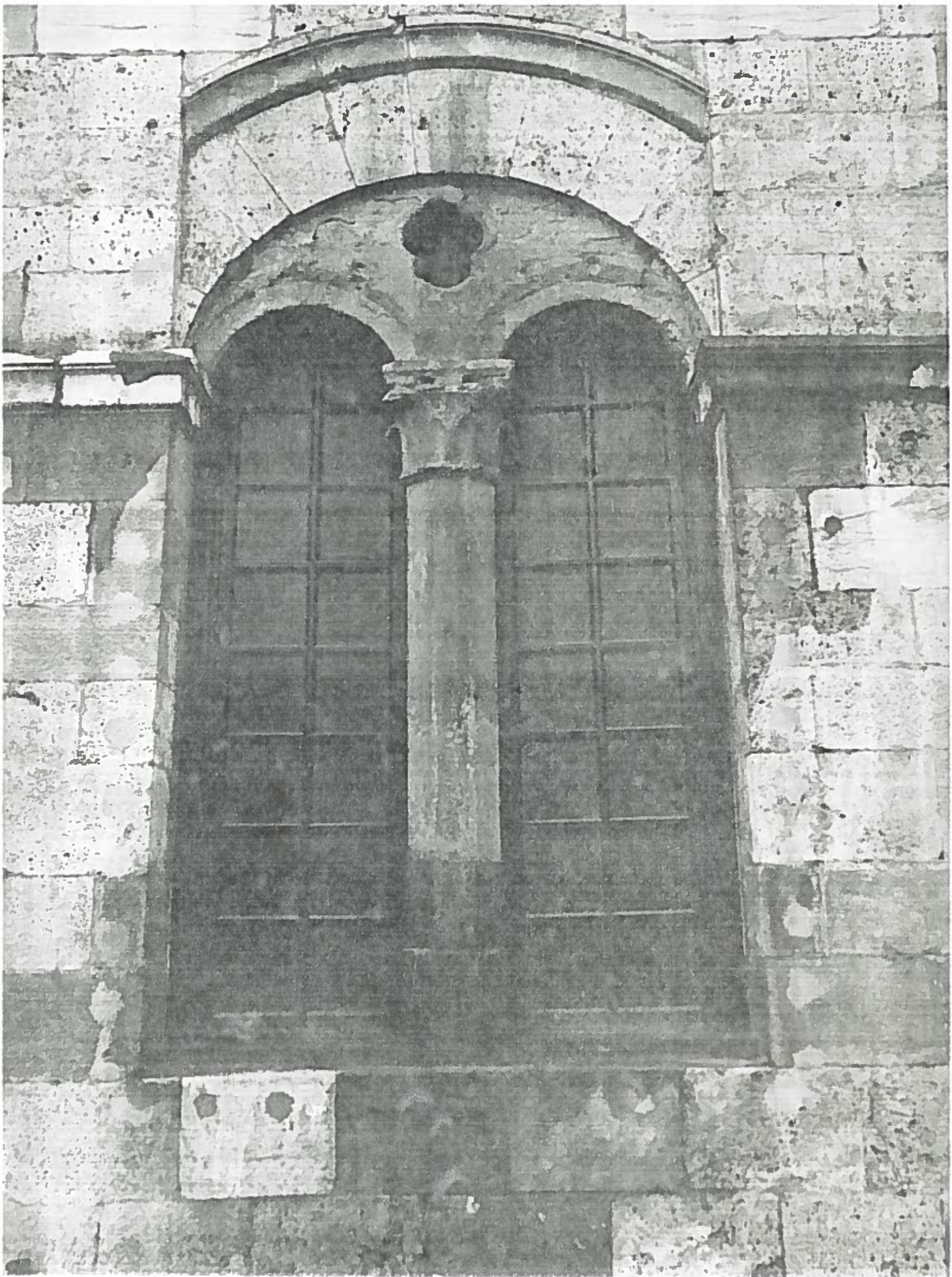
UNIVERSITÀ GAMBACORTI PALAZZO GAMBACORTI