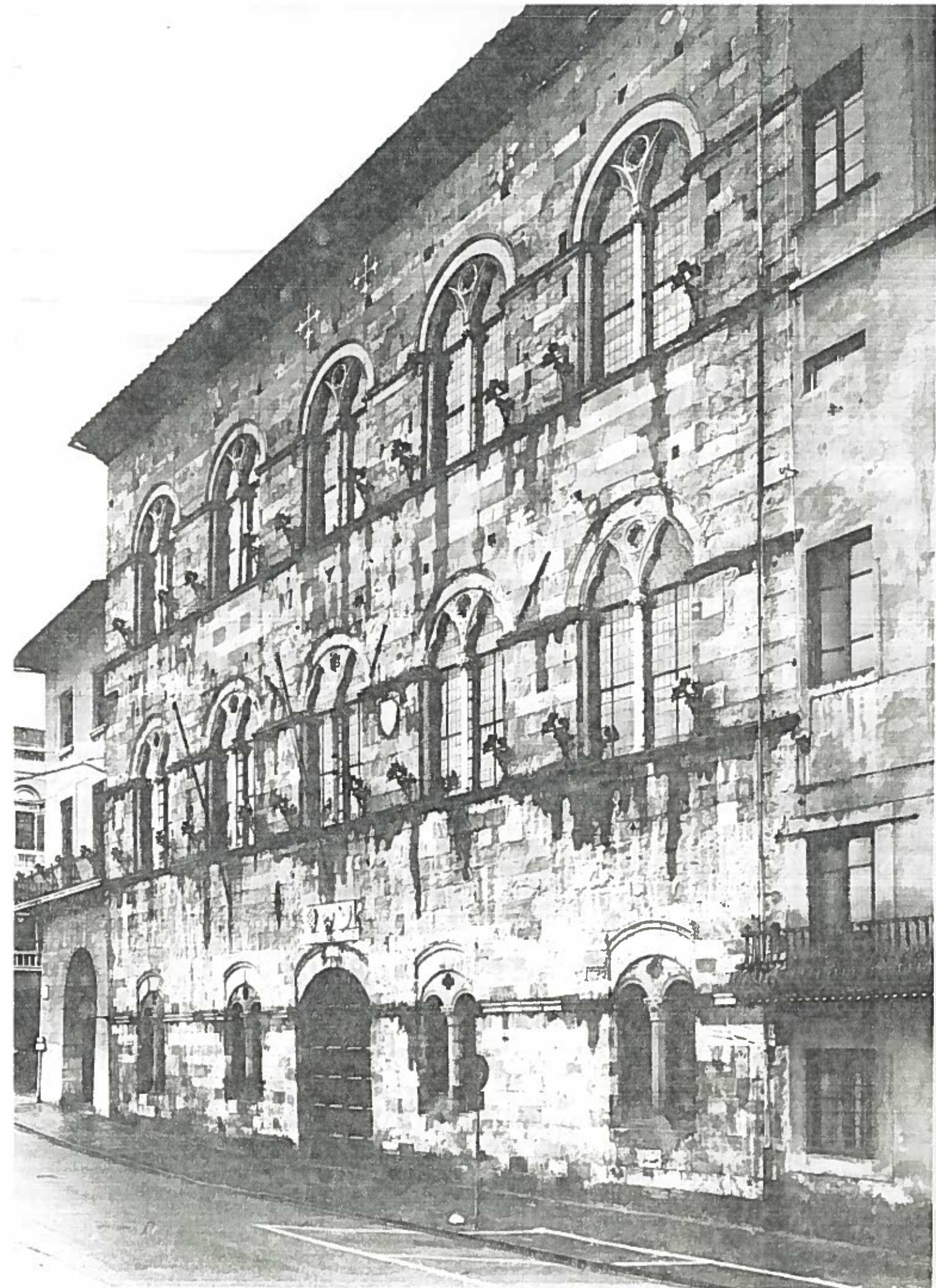
LUNG. GAMBACORTI - PALAZZO GAMBACORTI