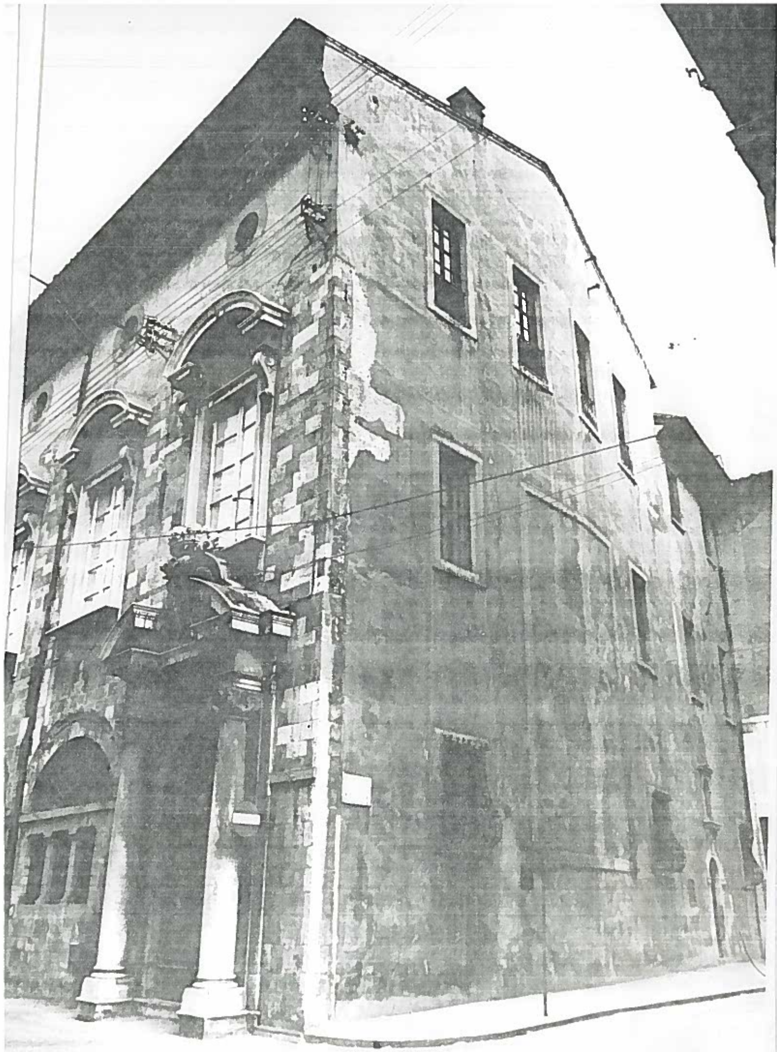
VIA TOSELLI - ANG. VIA DEGLI UFFIZI - ISOLATO 25 40/1 20.167