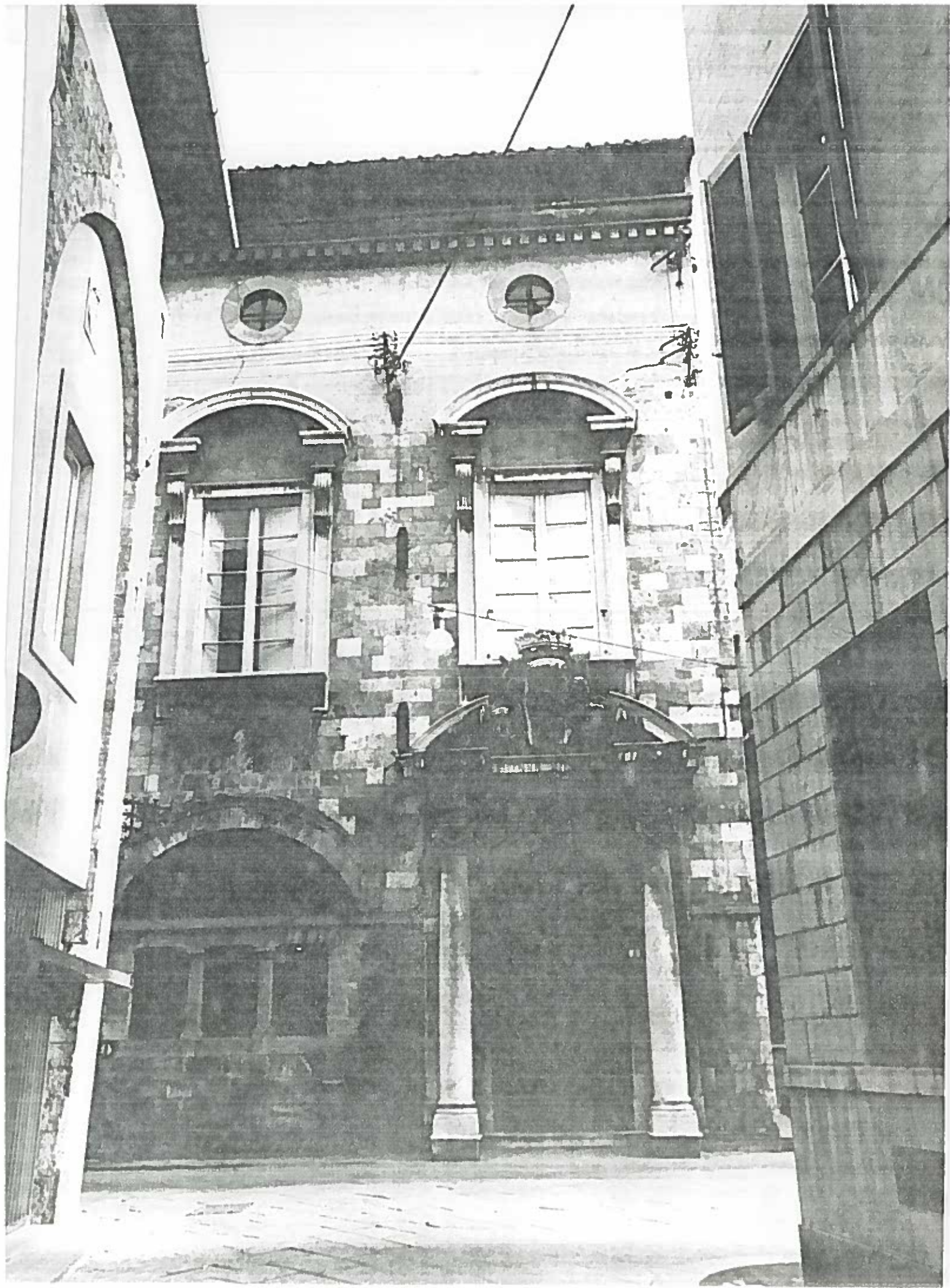
VICOZELLI - PORTALE al n° 2