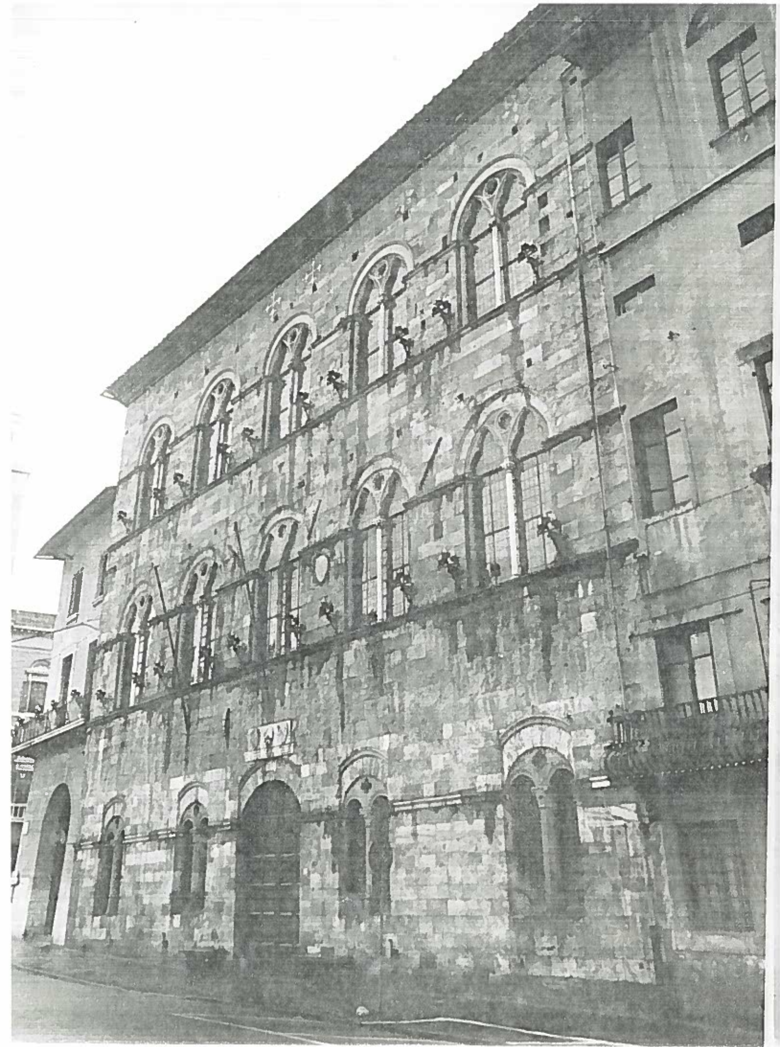
UNG. GAMBACORTI - PALAZZO GAMBACORTI n°1 ISOLATO 35 40/119238