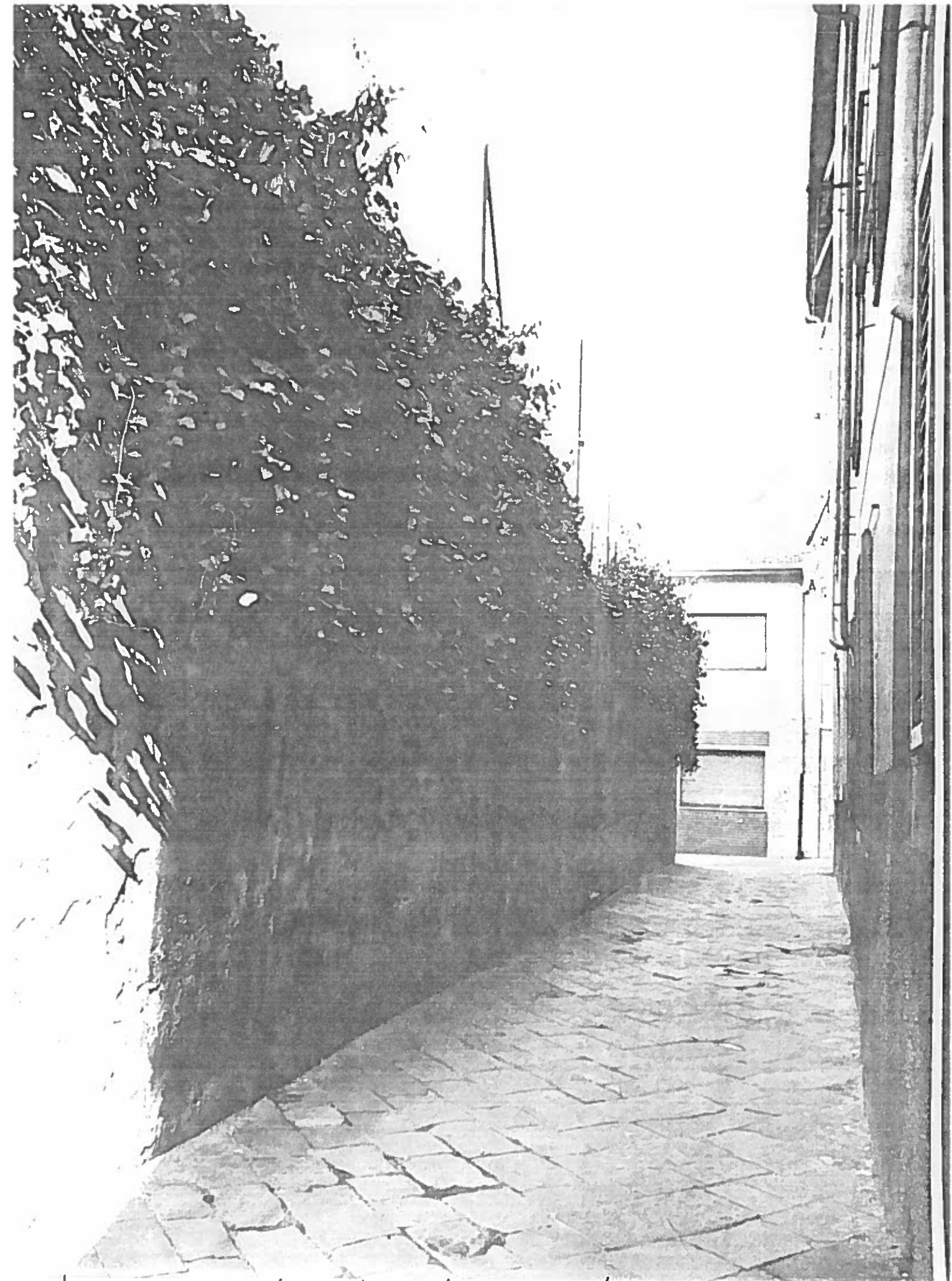
Vicolo S. Cosimo (VEDUTA)