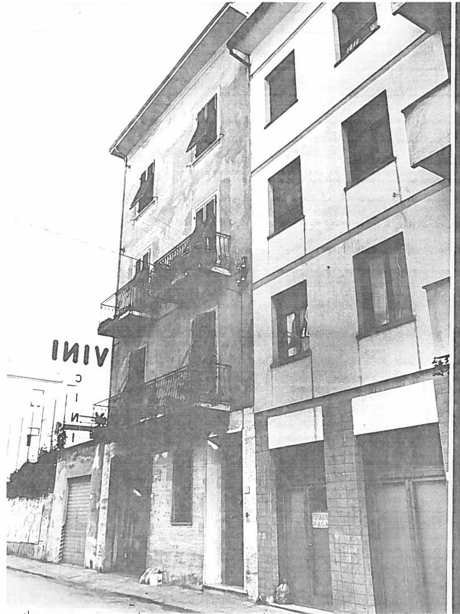
VIA S. ANTONIO 13/15/17 ISOLATO 25/4 NEGATIVO 19975