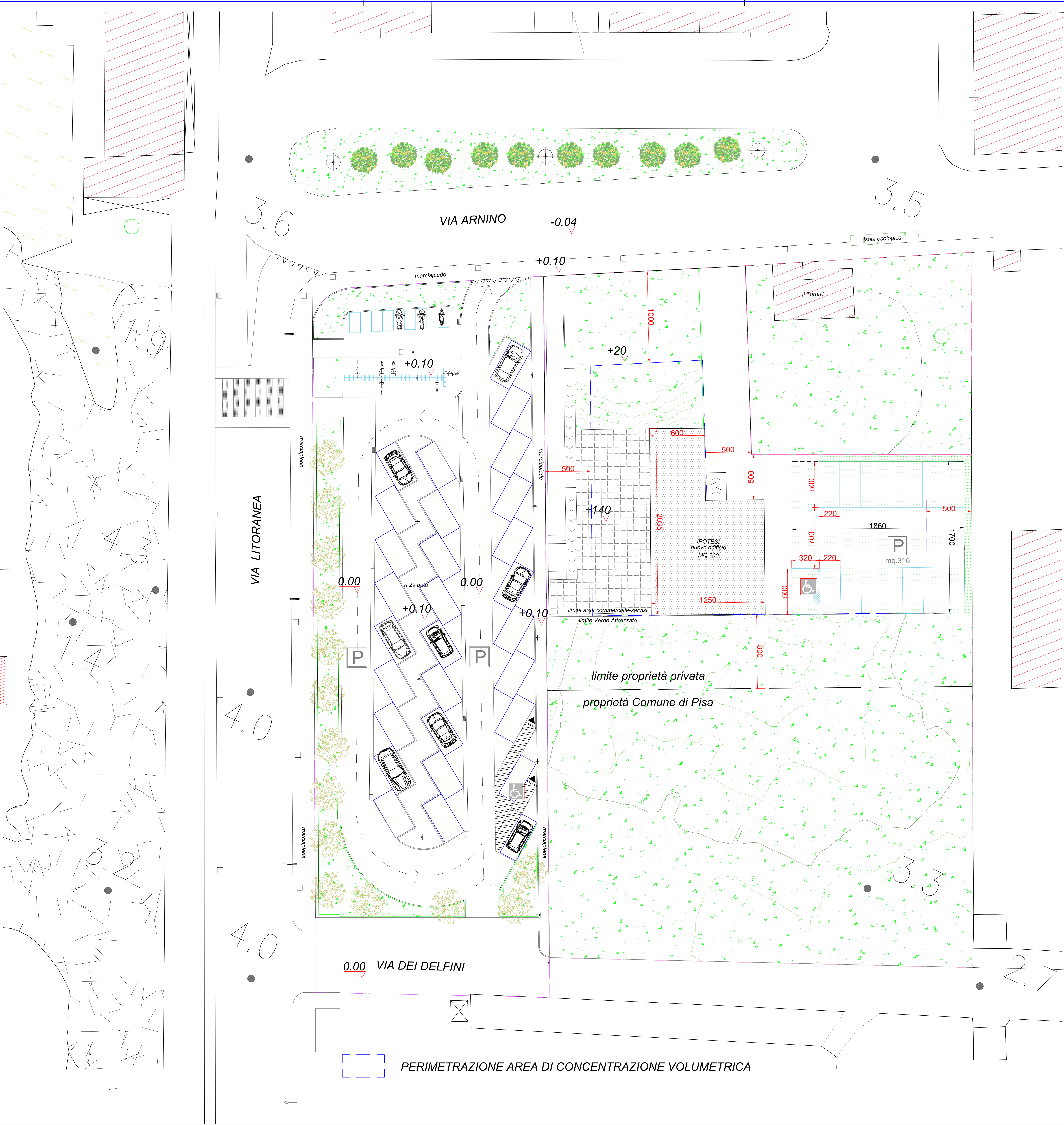
PERIMETRAZIONE AREA DI CONCENTRAZIONE VOLUMETRICA