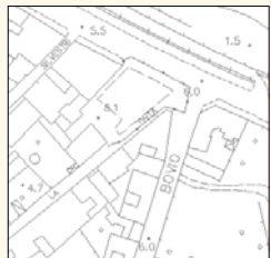
foglio 18f42.dwg (agg Provincia)