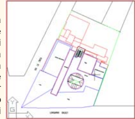
acquisizione del progetto (formato dwg)

mantenere aggiornata la cartografia di base con le trasformazioni del territorio, della toponomastica e della numerazione civica è fondamentale per garantire l'aggiornamento agli aggiornamenti catastali