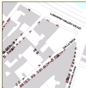
Carta Tecnica Regionale

mantenere aggiornata la cartografia di base con le trasformazioni del territorio, della toponomastica e della numerazione civica è fondamentale per garantire l'aggiornamento agli aggiornamenti catastali