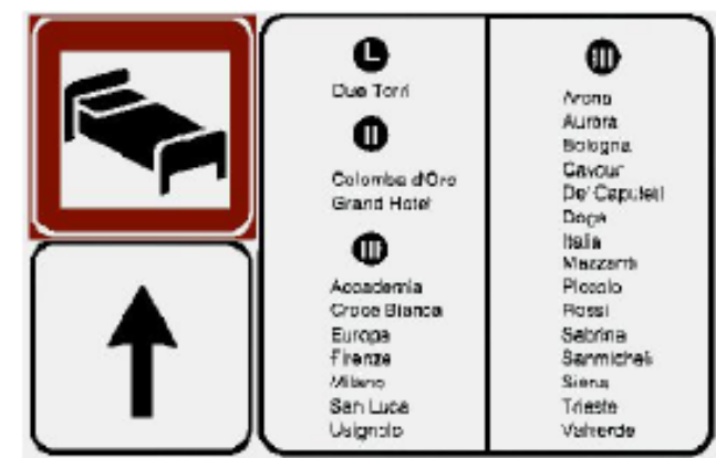
(figura II 299 art. 134 Codice della Strada)

b) una serie di segnali di preavviso e direzione, posti in sequenza in posizione autonome e non interferenti con la normale segnaletica stradale per indirizzare l'utente sull'itinerario di destinazione da posizionarsi unicamente sulle strade che conducono al luogo segnalato.