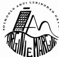
Argini e Margini