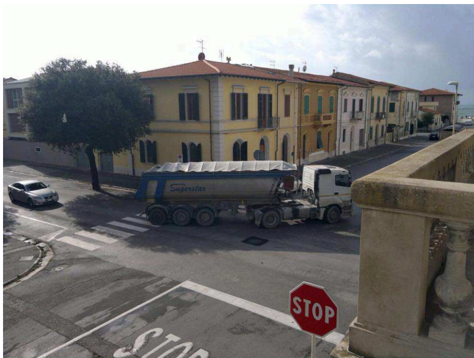
Nella foto l'incrocio di via dell' Ordine di S. Stefano con via Francardi , ore 12 circa del 4 novembre 2014.