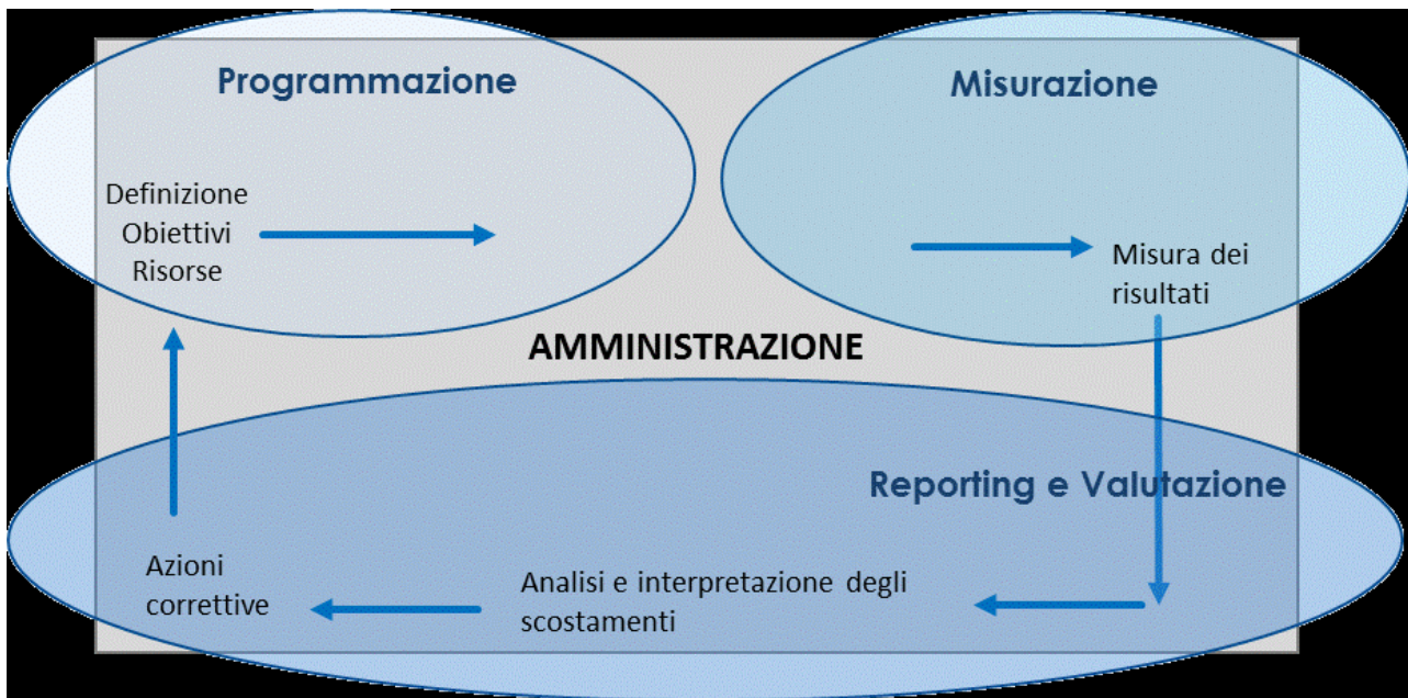
Figura 2 – Il ciclo della Performance (da Linee guida per la relazione annuale sulla performance-Dipartimento Funzione Pubblica-)

Al fine di dare avvio all'intero processo di misurazione e a seguire quello di valutazione, in data 13.12.2022, con nota prot. n 144352/2022 del Segretario Generale/Presidente OdV è stata inviata la richiesta dei report consuntivi per ogni tipologia di obiettivo.